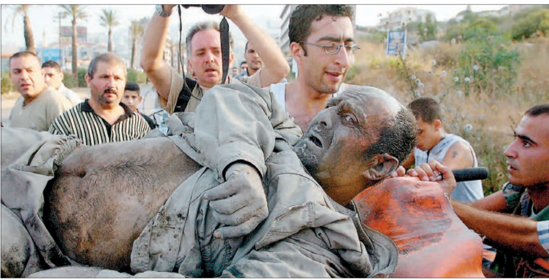
لبنانيون ينقلون مصاباً في الهجوم الجوي الاسرائيلي على جسر المعاملتين قرب ميناء «جونيه» امس [٢٩-٢٧]