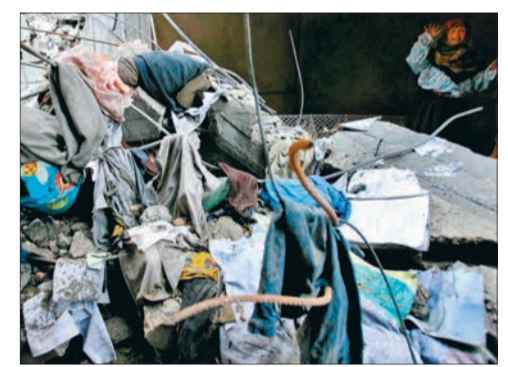
فلسطينية تنظر الى انقاض منزلها في غزة

اقترحم مسلحون يرتدون زي الشرطة الفلسطينية سجن أريحا بالضفة الغربية واطلقوا النار عشوائياً مما ادى الى مقتل ٦ من المعتقلين على الفور من بينهم ٥ يوجهون اتهامات بقتل اثنين من مسؤولي حركة فتح في مدينة نابلس العام الماضي. (التفاصيل ص ٢٨)