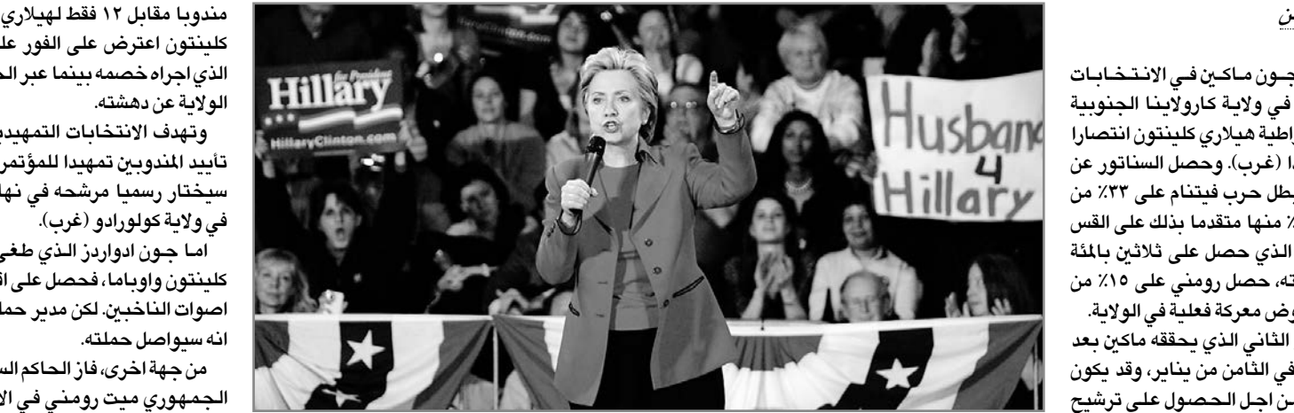
هيلاري تلقي كلمة خلال حملة انتخابية بمدينة فلورسنت

فاز الجمهوري جون ماكين في الانتخابات التمهيدية التي جرت في ولاية كارولينا الجنوبية بينما حققت الديموقراطية هيلاري كلينتون انتصارا واعدا في ولاية نيفادا (غرب). وحصل السناتور عن أريزونا جون ماكين بطل حرب فيتنام على ٢٣٪ من الأصوات بعد فرز ٩٢٪ منها متقدما بذلك على اللقب السابق مايك هاكاكي الذي حصل على ثلاثين بالمئة من الأصوات. من جهته، حصل رومني على ١٥٪ من الأصوات بدون ان يخوض معركة فعلية في الولاية. وهذا الانتصار هو الثاني الذي يحققه ماكين بعد فوزه في نيوهامشير في الثامن من يناير، وقد يكون حاسما في السباق من أجل الحصول على ترشيح الحزب الجمهوري للانتخابات الرئاسية التي ستجرى في نوفمبر المقبل. وفي فلوريدا، يواجه مرشحو الحزب الجمهوري رودولف جولياني عدة نيوبيوك السابق الذي لم يخض منافسة حادة مع خصومه في الانتخابات التي جرت حتى الآن. وفي الجانب الديموقراطي، فازت هيلاري كلينتون في ولاية نيفادا (غرب) وذلك للمرة الثانية من اصل ثلاث عمليات اقتراع وحصلت على