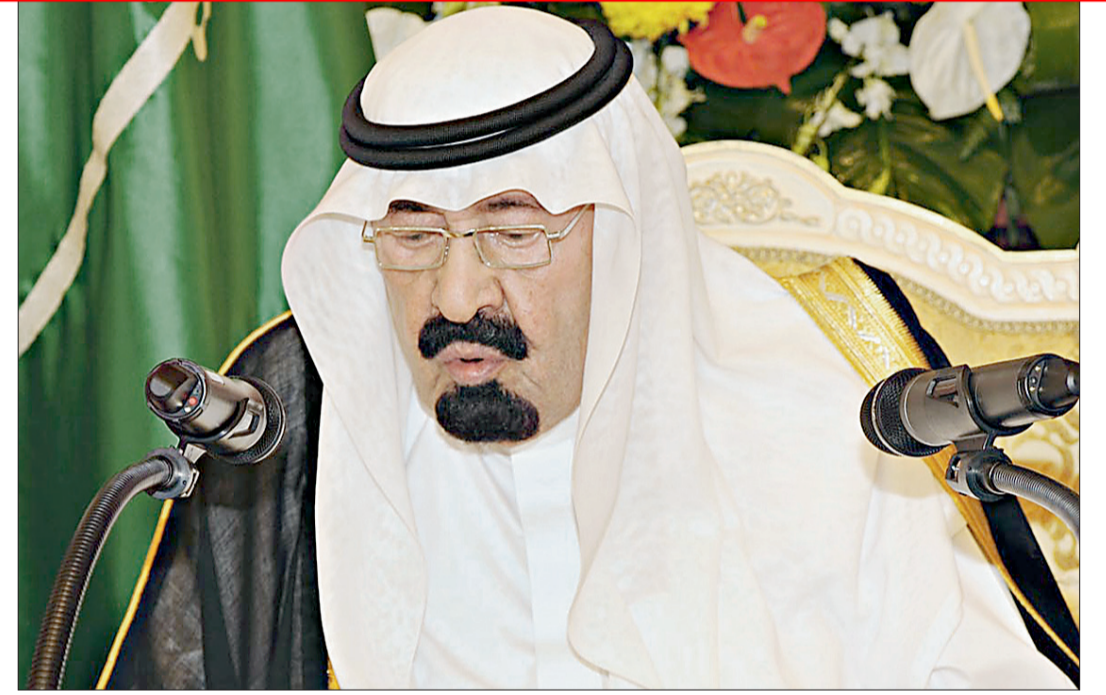
تفاصيل صفحة ٣٠٢

طالب خادم الحرمين الشريفين الملك عبدالله بن عبدالعزيز هيئة الأمم المتحدة بمشروع يدين أي دولة أو مجموعة تتعرض للأديان السماوية والأنبياء عليهم الصلاة والسلام. وأكد بحفظه الله في كلمة القاها أمس لدى لقائه في منى رؤساء الوفود الإسلامية الذي أعلن عنه في مكة المكرمة ليعني بالضرورة الاتفاق على أمور العقيدة، بل الهدف منه الوصول إلى حلول للفرقة وإحلال التعايش بين المذاهب بعيداً عن الدساس أو غيرها، الأمر الذي سيعود نفعه لصالح امتنا الإسلامية وجمع كلمتها.