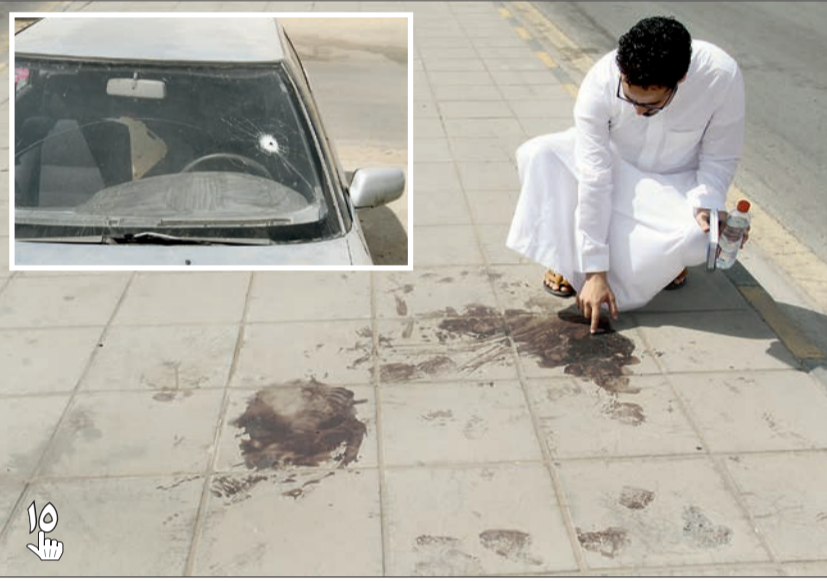
عكاظ تباشر مهمتها في موقع الحادث، وفي الإطار رصاصة وقد اخترقت زجاج مركبة.