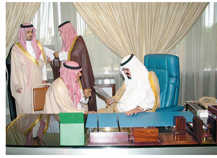
سمو الامير عبدالله لدى استقباله للمواطنين