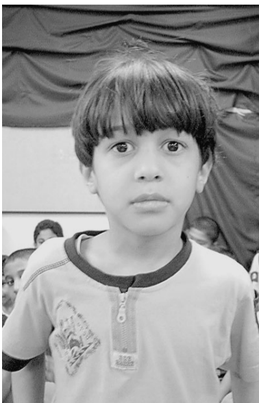
حزين لوفاة بابا فهد

يقول خالد ابو جابر ان الملك فهد -رحمه الله- هو رائد التعليم في المملكة وفي عهده ازدهر التعليم وبلغت المملكة