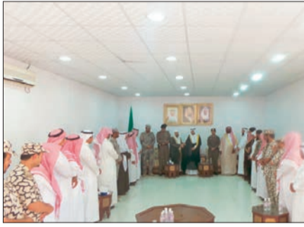
محافظ الدابر يستقبل المعززين والمبايعين.