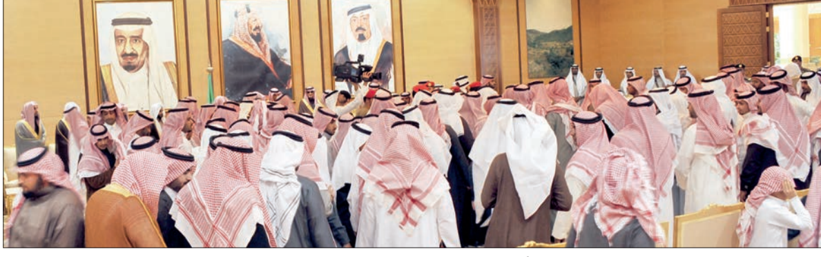
الأمير مشاري بن سعود مستقبلا المعززين والمبايعين.

ثم تمسك هذه البلاد بشريعة المولى عز وجل، سائلا الله أن يديم على هذه البلاد أمنها وأمانها ورفعة أهلها. وسال الجميع الله تعالى أن يتغمد خادم الحرمين الشريفين الملك عبدالله بن عبدالعزيز آل سعود بوسع مغفرتة ورضوانه، وأن يسكنه فسح جناته، وأن يوفق خادم الحرمين الشريفين الملك سلمان بن عبدالعزيز آل سعود، وسمو ولي عهده الأمين، وسمو ولي العهد - حفظهم الله - بتوفيقة وأن يمدهم بعونه لكل ما فيه خدمة الدين والوطن ومواصلة مسيرة البناء المباركة في لهذا الوطن المعطاء.