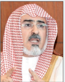
د. سليمان أبا الخيل

أشاد وزير الشؤون الإسلامية والأوقاف والدعوة والإرشاد الشيخ الدكتور سليمان بن عبدالله أبا الخيل، باللمحة الوطنية، والمشاعر الصادقة لأبناء الوطن عقب وفاة فقيد الأمة الملك عبدالله بن عبدالعزيز، منوها بجهوده - رحمه الله - في خدمة الوطن، وبعد نظره وحكمته وقوته وصلابته في مواجهة التحديات في جميع المحافل الدولية، وجهوده لخدمة الإسلام والمسلمين ورفع الوترين أبا الخيل مجددا التعازي إلى القيادة الرشيدة باسمه ونيابة عن منسوبي الوزارة، كما رفع باسمه ونيابة عن منسوبي الوزارة المحلصة والولاء الصادق إلى خادم الحرمين الشريفين الملك سلمان بن عبدالعزيز آل سعود، وسمو ولي عهده الأمين، وسمو ولي العهد - حفظهم الله - جاء ذلك لدى استقباله أمس منسوبي الوزارة الذين قدموا له التعازي في وفاة الملك عبدالله مبايعين للقيادة.