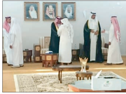
محافظ ضمد يستقبل المواطنين.