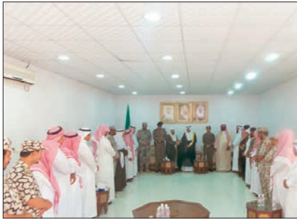
محافظ الدابر يستقبل المعززين والمبايعين.