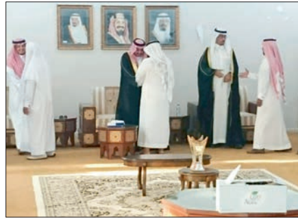
محافظ ضمد يستقبل المواطنين.