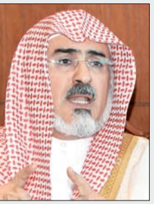
د. سليمان أبا الخيل

أشاد وزير الشؤون الإسلامية والأوقاف والدعوة والإرشاد الشيخ الدكتور سليمان بن عبدالله أبا الخيل، باللحمة الوطنية، والمشاعر الصادقة لأبناء الوطن عقب وفاة فقيد الأمة الملك عبدالله بن عبدالعزيز، منوها بجهوده - رحمه الله - في خدمة الوطن، وبعد نظره وحكمته وقوته وصلابته في مواجهة التحديات في جميع المحافل الدولية، وجهوده لخدمة الإسلام والمسلمين ورفع الوترز أبا الخيل مجددا التعازي إلى القيادة الرشيدة باسمه ونياية عن منسوبي الوزارة، كما رفع باسمه ونياية عن منسوبي الوزارة المحلصة والولاء الصادق إلى خادم الحرمين الشريفين الملك سلمان بن عبدالعزيز آل سعود، وسمو ولي عهده الأمين، وسمو ولي العهد - حفظهم الله - جاء ذلك لدى استقباله أمس منسوبي الوزارة الذين قدموا له التعازي في وفاة الملك عبدالله مبايعين للقيادة.