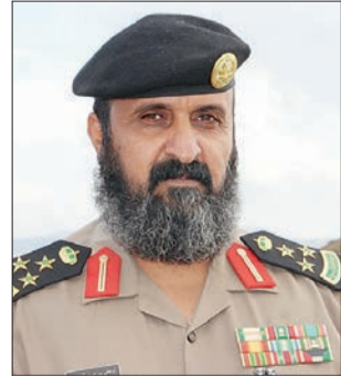
العميد تركي العتيبي