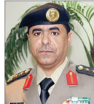
العميد سعد الطراد