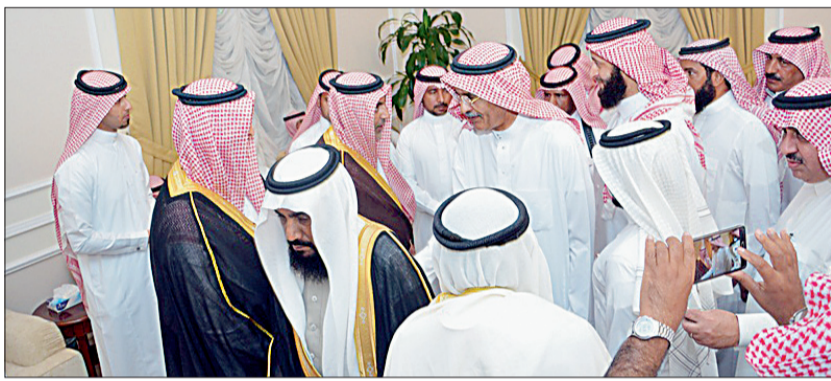
السليم لدى استقباله المعزين في وفاة الملك عبدالله.

السمو الملكي الأمير محمد بن نايف بن عبدالعزيز آل سعود.