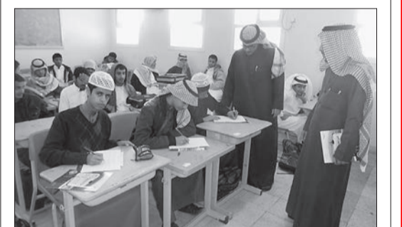
المعلمون يشرحون على الطلاب أثناء كتابة رثاء للفقيد الراحل.