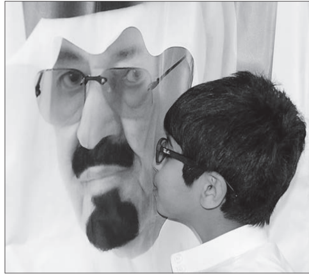
أحد طلاب المدينة يطبع قبلة على صورة الملك الراحل.