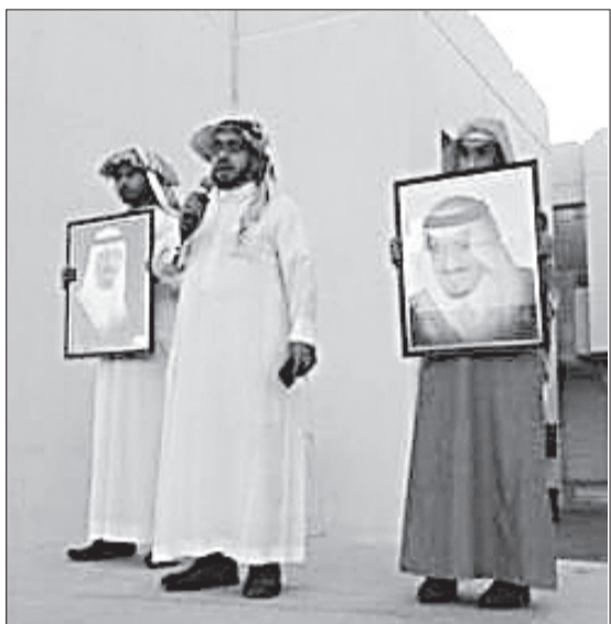
معلمان يحملان صورتي الملك الراحل والملك سلمان.