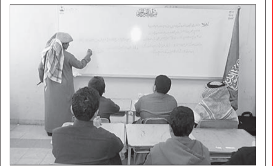
رثاء للملك الراحل في أول حصة دراسية بمتوسطة الأوزاعي بأبها.