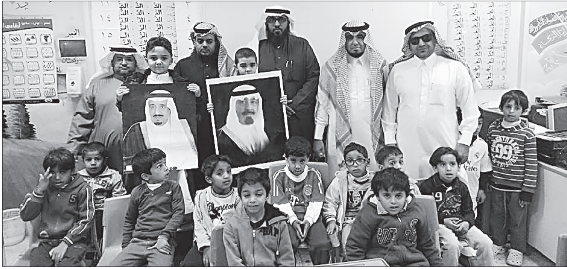
معلمو وطلاب مدرسة العريض الابتدائية في لحظة جماعية عقب مبايعتهم للملك سلمان.