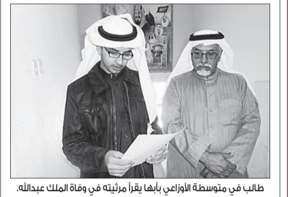
طالب في متوسطة الأوزاعي يقرأ مراثية في وفاة الملك عبدالله.