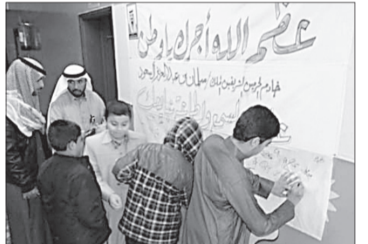
طلاب الجوف يقدمون التعازي في وفاة الملك عبدالله.

خصصت مدارس البنين والبنات التابعة للإدارة العامة للتربية والتعليم بمنطقة الرياض، الطابور الصباحي والحصتين الأولى والثانية، لتعزيب القيم الوطنية، وذكر مآثر فقيد الوطن الملك عبدالله بن عبدالعزيز - رحمه الله - وما قدمه لخدمة الأمة الإسلامية ولرفعة الوطن واهتمامه بالتعليم ومبايعه خادم الحرمين الشريفين الملك سلمان بن عبدالعزيز ملكا للبلاد، وصاحب السمو الملكي الأمير مقرن بن عبدالعزيز وولي العهد، وصاحب السمو الملكي الأمير محمد بن نايف بن عبدالعزيز وزير الداخلية وولي ولي العهد. وأوضح مدير عام التربية والتعليم بالمنطقة المكلف محمد بن عبدالله المرشد، أن الملك عبدالله بن عبدالعزيز - رحمه الله - كان قائدا حقيقيا لمسيرة النهضة التعليمية ومن حقه علينا تعريف أبنائنا الطلاب والطالبات بإنجازاته، وبإذن الله تتواصل المسيرة مع رجل الوفاء والحكمة خادم الحرمين الشريفين الملك سلمان بن عبدالعزيز، وسمو ولي عهده، وسمو ولي ولي العهد.