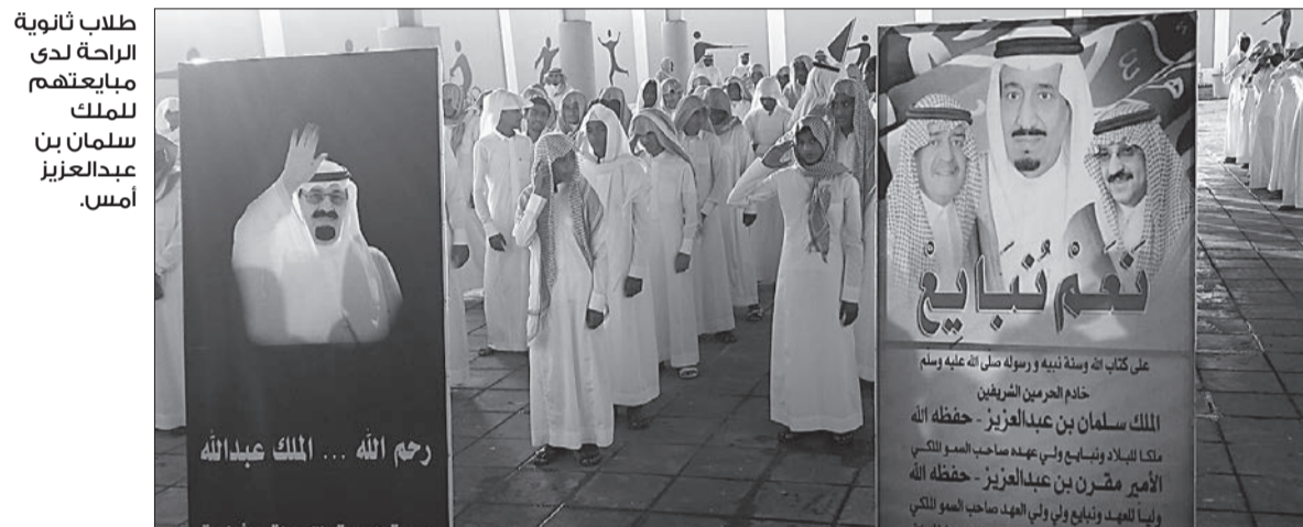
طلاب ثانوية الراحة لدى مبايعتهم للملك سلمان بن عبدالعزيز أمس.

مبايعتهم لخدم الحرمين الشريفين الملك سلمان بن عبدالعزيز آل سعود، وصاحب السمو الملكي الأمير مقرن بن عبدالعزيز آل سعود، وصاحب السمو الملكي الأمير محمد بن نايف بن عبدالعزيز آل سعود وولي ولي العهد.