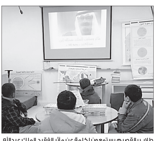
طلاب بالقصيم يستمعون لكلمة عن مآثر الفقيد الملك عبدالله.

رسم طلاب القصيم مع انطلاقه الفصل الدراسي الثاني، لوحة وفاء مضيئة، تحمل أجمل معاني اللحمة الوطنية، بين قائد ملهم وشعب محب، عبروا فيها عن حزنهم لوفاة الملك عبدالله، وجددوا البيعة للملك سلمان بن عبدالعزيز، وولي العهد، وولي العهد. وكان صباح أمس استثنائياً، فقد فيه طلاب وطالبات المنطقة والدمع ومحبهم - المغفور له بإذن الله - الملك عبدالله بن عبدالعزيز، حين خصص القائمون على التعليم بالمنطقة أمس الحصتين الأولى والثانية، والإصطفاف الصباحي لذكر مآثر الفقيد ومناقشته وجاءت العديد من الفقرات والبرامج الإثرائية، تأكيداً على غرس القيم الوطنية وتعزيبها، وإبرازاً لمفاهيم البيعة في المنشط والمكره لخدم الحرمين الشريفين الملك سلمان بن عبدالعزيز، وسمو ولي عهده صاحب السمو الملكي الأمير مقرن بن عبدالعزيز، وسمو ولي ولي العهد صاحب السمو الملكي الأمير محمد بن نايف بن عبد العزيز، فقد تمازجت فقرات الأسى والحزن برحيل «عبدالله» بمظاهر الأمان والاستقرار بتولي خادم الحرمين الشريفين الملك سلمان بن عبد العزيز مقاليد الحكم في البلاد.