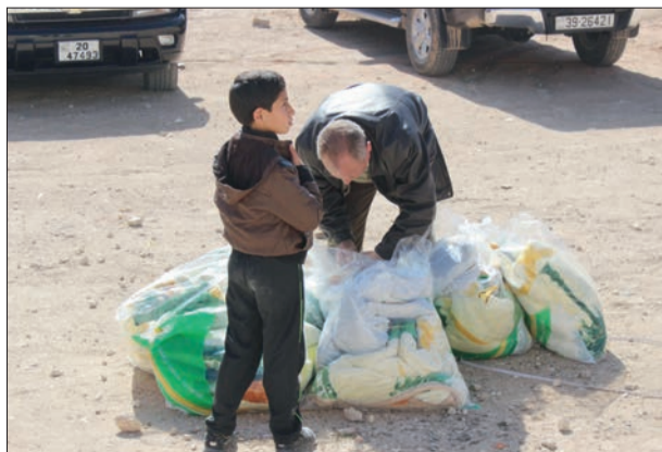
أب وابنه بعد تسلّم المعونات.

وذكر المدير الإقليمي للحملة الدكتور بدر بن عبد الرحمن السمحان، أن الحملة الوطنية السعودية تؤكد استمرارها في مد يد العون والمساعدة للاجئين السوريين في دول الجوار والنازحين، منهم في الداخل السوري، عبر برامجها الإغاثية والطبية والإيوائية والاجتماعية والتعليمية التي تم إعدادها ودراساتها مسبقاً، ويسير العمل على تنفيذها وفقاً لاحتياج الأشقاء اللاجئين السوريين، مشيداً بالدعم الذي يقدمه خادم الحرمين الشريفين الملك سلمان بن عبدالعزيز، وسمو ولي