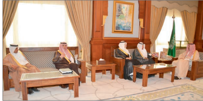
أمير المدينة يستقبل مسؤولي شركة ساسكو.

رفع صاحب السمو الملكي الأمير فيصل بن سلمان بن عبدالعزيز أمير منطقة المدينة المنورة وبإسماه ونيابة عن أهالي منطقة المدينة المنورة برفقات عزاء ومواساة لخادم الحرمين الشريفين الملك سلمان بن عبدالعزيز آل سعود ولصاحب السمو الملكي الأمير مقرن بن عبدالعزيز آل سعود ولي العهد نائب رئيس مجلس الوزراء، ولصاحب السمو الملكي الأمير محمد بن نايف ولي العهد نائب رئيس مجلس الوزراء وزير الداخلية - حفظهم الله - في وفاة خادم الحرمين الشريفين الملك عبدالله بن عبدالعزيز رحمه الله.