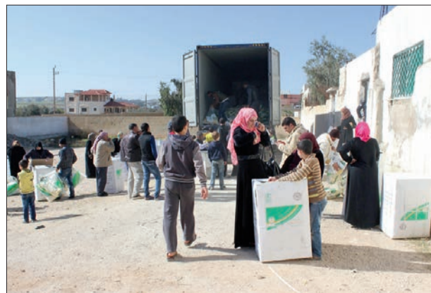
سيدة سورية تتسلم معونات من الحملة السعودية.