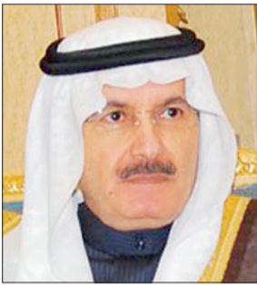
الأمير خالد بن عبدالله

يستقبل صاحب السمو الملكي الأمير خالد بن عبدالله بن عبدالعزيز في قصره بجدة، المعزين في فقيد الأمة المغفور له بإذن الله خادم الحرمين الشريفين الملك عبدالله بن عبدالعزيز، اليوم الخميس وغدا الجمعة.