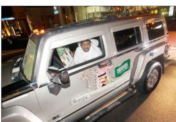
مظاهر الفرح والمشاركة في الاحتفالات بيوم الوطن تمت أسس بكافة المناطق.