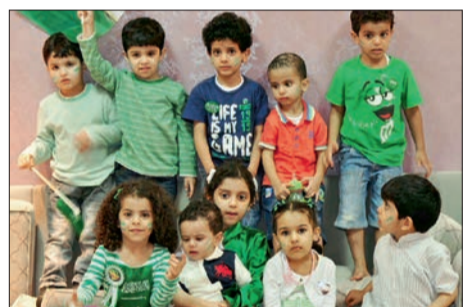
أطفال كما بدأ أمس متخفين بالوطن.