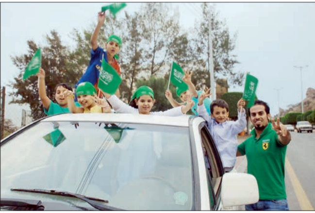
أطفال يحتفلون بطريقتهم الخاصة بذكرى يوم الوطن في أبها.