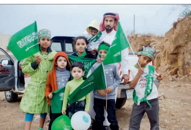
أسرة تحتفل باليوم الوطني في أبها أمس.