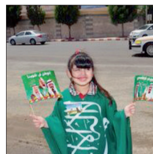
فهد بنت بندر بن خثيلة

احتفت شوارع عسير أمس بالشباب والأطفال وذويهم، احتفالا باليوم الوطني، في ظل تواجد كثيف للجهات الأمنية ذات العلاقة، من دوريات للشرطة والمرور والدفاع المدني، وشهدت الطرق الرئيسية خاصة طريق الحزام الدائري وسط أبها، وطريق المنتزهات المسيرات الشبابية وامتدت المرافق العامة والحدائق بالعائلات والأطفال، الذين خرجوا للتنزه ومشاهدة الاحتفالات الشعبية باليوم الوطني، وهم متوشحون بالأعلام وصور القيادة. وكانت الجهات الأمنية وضعت خططها منذ وقت مبكر، عبر كثيف التواجد الميداني ومتابعة المسيرات وعدم الإخلال بالأمن، بعد أن مضى في مسيرتها بعيدا عن الدخول إلى الأحياء السكنية. ■