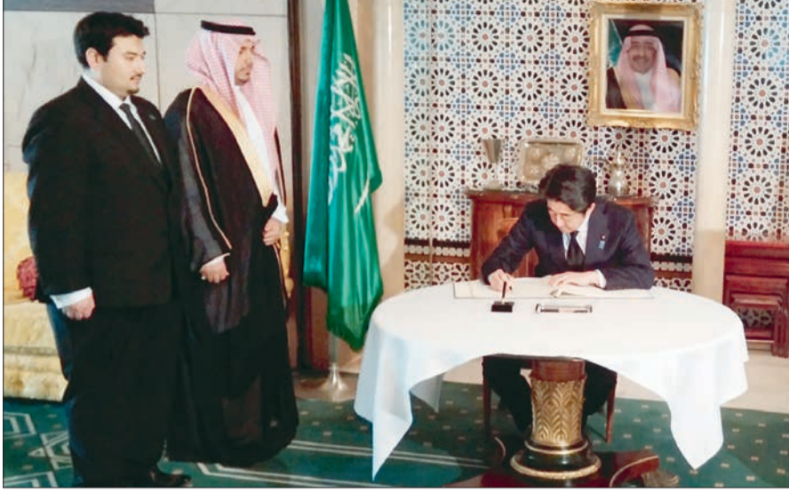
رئيس الوزراء الياباني يعبر عن مواساته للشعب السعودي عبر كلمة دونها في مقر السفارة.