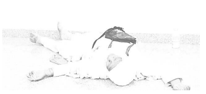
حاجة عجز مصابة بالإرهاب الحراري (٢ ص)