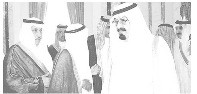
سموه لدى استقباله المهنيين (٢ ص)