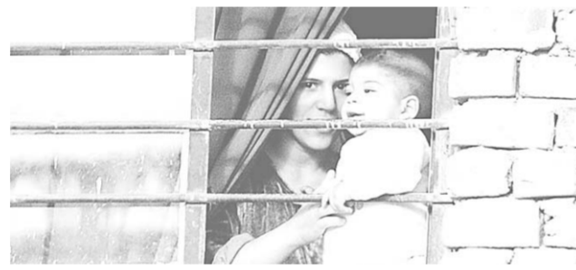
عراقية وطفلها يطلان من النافذة على العيد والمستقبل المجهول (التفاصيل ص ١٥)

تابع أعضاء الأطلسي أمس مشاوراتهم للخروج من الأزمة، في الوقت الذي أكد مصدر حكومي ألماني أن ١١ عضواً من أصل ١٥ داخل مجلس الأمن سيؤيدون يوم الجمعة المطروحات الألمانية - الفرنسية بتمديد التفتيش من أجل تحاشي الحرب. ويلتقي قادة الدول الأوروبية اله ١ يوم الاثنين المقبل استجابة لدعوة وجهتها اليونان بصفتها رئيس الاتحاد، لمناقشة تطورات الأزمة العراقية. (التفاصيل ص ١٥)