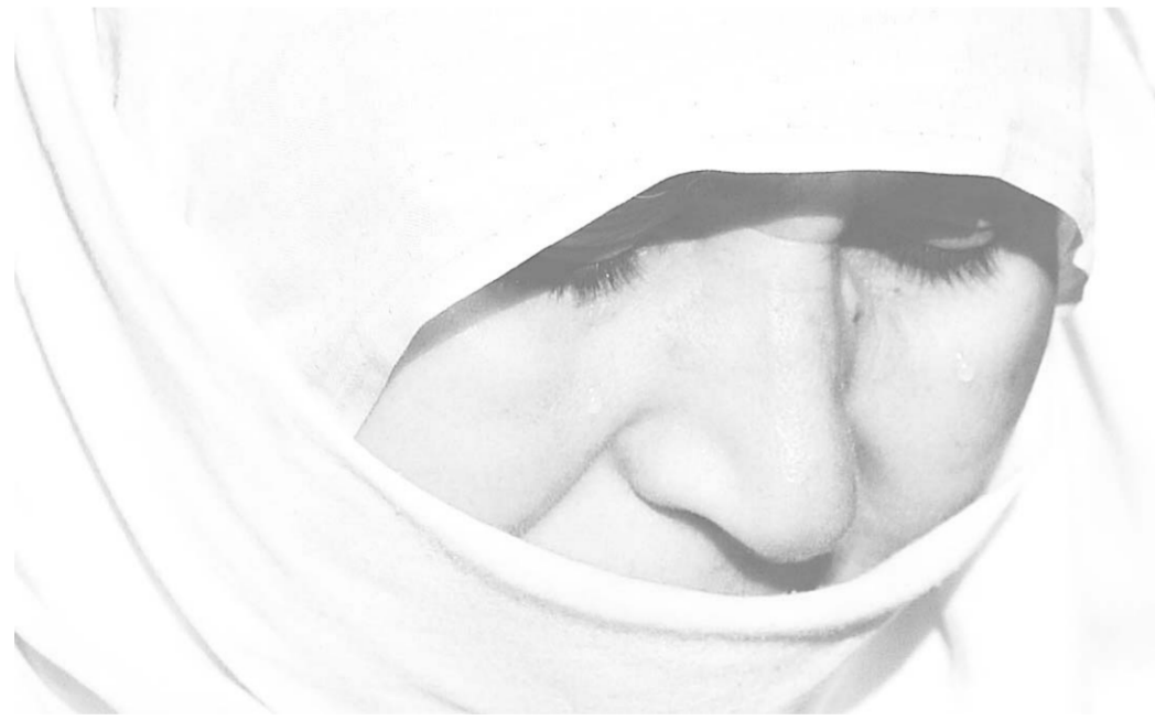
دموع العجز في العيد تجسد مأساة الفلسطينيين في الضفة والقطاع

فرضت وزارة الدفاع الاسرائيلية حظر تجول كاملاً في كل الأراضي الفلسطينية وألغت تدابير تخفيف القيود التي كانت قد أعلنت عنها بمناسبة عيد الأضحى، بسبب تقارير تحدثت عن هجمات على نطاق واسع في إسرائيل، خلال الأيام القليلة المقبلة. وتحدثت صحيفة «يديعوت اخرونوت»، في موقعها على الانترنت عن «دفق متواصل من التحذيرات حول هجمات كبيرة محتملة، فيما نصحت الشرطة وجهاز الأمن الداخلي (الشين بيت) بفرض الإقفال التام على الأراضي الفلسطينية. وأمس استشهد فلسطيني برصاص الجيش الاسرائيلي في قطاع غزة، وذكر مصدر فلسطيني أن قنبلة ألقيت على منزل أحد أعضاء حركة «فتح»، في مخيم عين الحلوة (الجنوب اللبناني) لكنها لم تسبب إصابات. ومعروف أن اعتداءات بالقنابل اليدوية أو الديناميت، تستهدف رموز كل المنظمات الفلسطينية الموالية لفتح، أو سوريا وبشكل شبه يومي في عين الحلوة أكبر المخيمات الفلسطينية في لبنان. وتتلاقى الفصائل الفلسطينية على أن هذه الاعتداءات تهدف إلى إيقاع التوتر داخل المخيم لأغراض مشبوهة. ولم تتوصل الجهات الأمنية اللبنانية بالتعاون مع الأجهزة السورية والفلسطينية الى وضع حد لها حتى الآن. (التفاصيل ص ١٤)