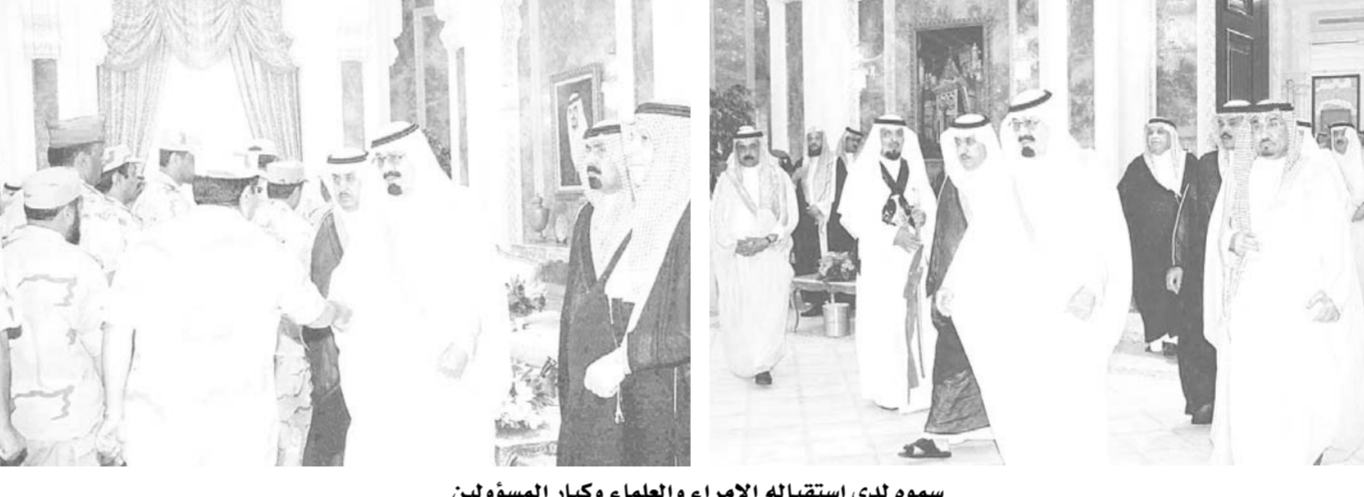
سمو لدى استقباله الامراء والعلماء وكبار المسؤولين

المعالى الوزراء وكبار المسؤولين من مدنيين وعسكريين الذين هناوا سموه بعيد الاضحى المبارك . حضر الاستقبال صاحب السمو الملكي الأمير سلطان بن عبدالعزيز النائب الثاني لرئيس مجلس الوزراء وزير الدفاع والطيران والمفتش العام وصاحب السمو الملكي الأمير نواف بن عبدالعزيز رئيس