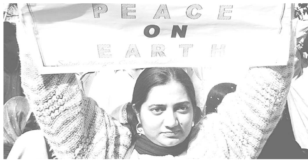
باكستانية تطالب بالسلام على الأرض في مظاهرة ضد الضربة الامريكية