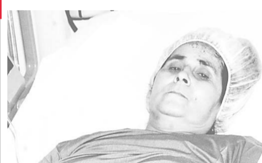
حاجة مغربية أصيبت في الحادث (ص ٣٥)