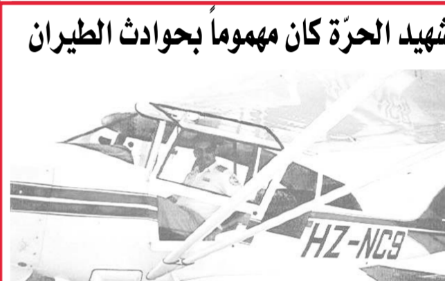
شاهد الحرة كان مهموماً بحوادث الطيران

يجري الملك عبدالله الثاني اليوم محادثات مع خادم الحرمين الشريفين وسمو ولي عهده حول التطورات المتصلة بالأزمة العراقية، وموضوع تقديم