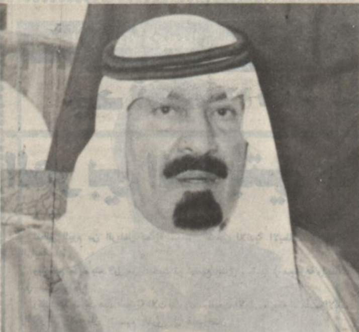
صاحب السمو الملكي الامير/ عبدالله بن عبدالعزيز

الأمير بدر بن عبدالعزيز يولي رياضة الفروسية اهتماما كبيرا انعكس على نشاطات النادي وارتقاء مستوى الفروسية. وأمل ان يظهر سباق اليوم بالمستوى الجيد الذي يعكس مدى ماوصلت اليه الجياد السعودية من تقدم.