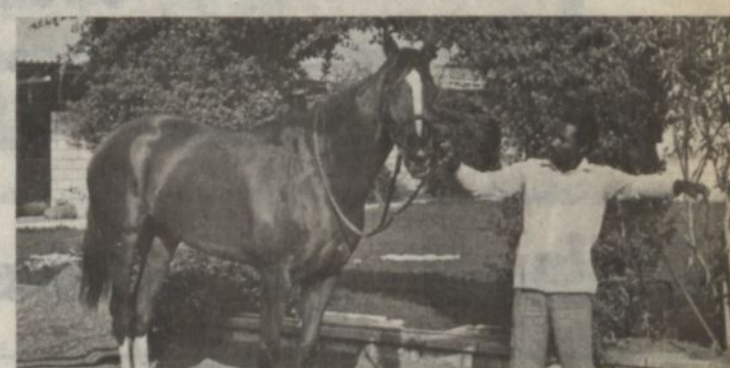
• «سلمان» أبرز المرشحين

يشرف صاحب السمو الملكي الأمير عبدالله بن عبدالعزيز ولي العهد ونائب رئيس مجلس الوزراء رئيس الحرس الوطني ورئيس نادي الفروسية حفل سباق النادي الـ ٣١ على كأس سموه التاسعة عشرة ويكون الحفل من أربعة اشواط وسيكون الشوط الاخير على