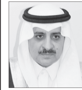
الأمير فهد بن سلطان

كما أن المخططات الفكرية والمرتكبات السياسية التي تعتمد عليها المملكة في توجهاتها الإنسانية ومواقفها المتعاطفة مع الدول والمجتمعات قد أعطت المساعدات السعودية صفة الخصوصية والتفرد، وذلك نابع من تمسك قيادة هذه البلاد وشعبها بروح وقيم الإسلام والانفraz بجوهر التعاون والتكافل.