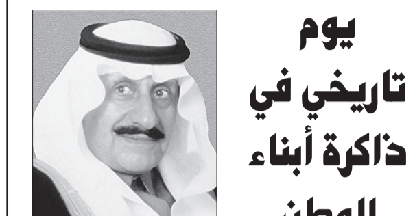
الأمير عبدالله بن عبدالعزيز

لقد استطاع خادم الحرمين الشريفين، حفظه الله، أن يرفع النهضة والنظور الذي تعيشه بلادنا وأن يقبل المملكة