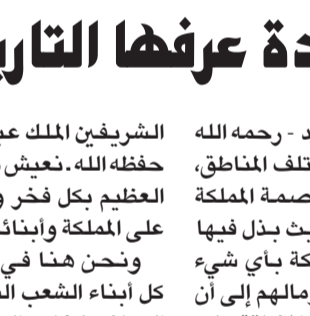
الأمير عبدالله بن عبدالعزيز

ونحن هنا في منطقة تبوك نتشرف أن نشارك كل أبناء الشعب السعودي هذا اليوم العظيم ونرفع التهاني لخادم الحرمين الشريفين الملك عبدالله بن عبدالعزيز آل سعود، وسمو ولي عهده الأمين، وسمو النائب الثاني - حفظهم الله - ولجميع شعب المملكة.