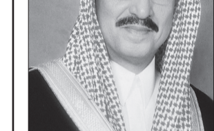
الأمير محمد بن ناصر

وصف صاحب السمو الملكي الأمير محمد بن ناصر بن عبدالعزيز أمير منطقة جازان اليوم الوطني للمملكة بأنه يوم مجيد تتوالى فيه الإنجازات.