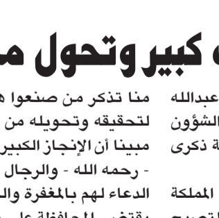
الأمير فهد بن سلطان

هنا صاحب السمو الأمير الدكتور خالد بن عبدالله بن مشاري عضو مجلس الشورى رئيس لجنة الشؤون التعليمية والبحث العلمي القيادة الرشيدة بمناسبة ذكرى اليوم الوطني الثالث والثمانين للمملكة.