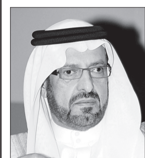
الأمير سعود بن عبدالمحسن

جميع الأراضي والمنتج في مخططات مدينة جدة شركة أموال العالمية العقارية ت: ٢٩٠٢٢٢٢ - ٥٦٨٦٧٢٢٢٢ أبحر الشمالية - بايزيد - النسيم - بالبيد - العمرية - الخالدية السياحي منح ٥٠٥ - منسج ٩٩/ج/س - منح ٦/ج/س - منح خليج سلمان - منح الهجره - منح جوهرة العروس - منح جنوب جدة الخمره - منح عسفان وشرق الخط السريبع