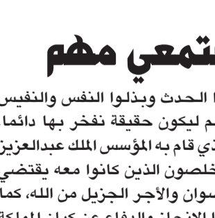
الأمير عبدالله بن عبدالعزيز

وأوضح سموه أن قيادات المملكة من بعد الملك المؤسس - رحمه الله - استمرت على نهجه وتابعت مسيرة التنمية للمملكة في المجالات المعيشية والاقتصادية والتعليمية والصحية والاجتماعية والعمرائية وغيرها من المجالات