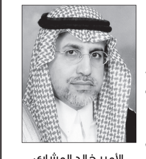
الأمير خالد بن عبدالعزيز

واستطرد سموه: وفي هذا العهد الزاهر لسيدي خادم الحرمين الشريفين الملك عبدالله بن عبدالعزيز آل سعود، حفظه الله ورعاه، شهدت المملكة قفزات تنموية واقتصادية واجتماعية هائلة لم يسبق لها مثيل، حيث سخرت جميع موارد الدولة لخدمة الوطن