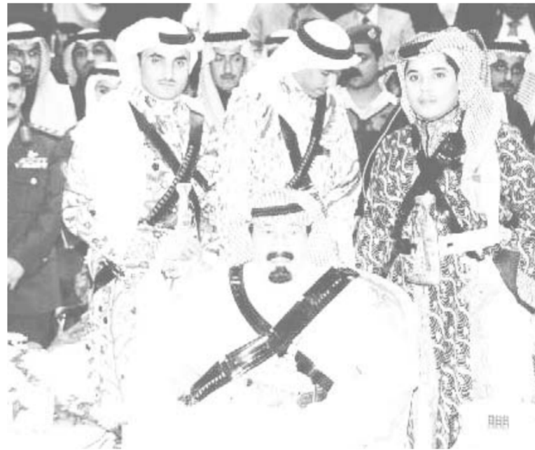
سموه يتابع فقرات احتفالية العرضة في المهرجان الوطني للتراث والثقافة

والثقافة وذلك في صالة الالعاب الرياضية المغلفة بطريق الدرية. وكان في استقبال سموه لدى وصوله مقر الصالة صاحب السمو الملكي الامير سلمان بن عبدالعزيز أمير منطقة الرياض وصاحب السمو الملكي الامير سحام بن عبدالعزيز نائب أمير منطقة الرياض وصاحب السمو الملكي الفريق أول ركن متعب بن عبدالله بن عبدالعزيز نائب رئيس الحرس الوطني المساعد للشؤون العسكرية نائب رئيس اللجنة العليا للمهرجان الوطني للتراث