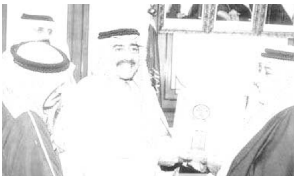
الامير مقرن يسلم رؤساء المراكز الشهادات

ويأتي تنفيذ هذه الدورة في اطار النشاطات التدريبية التي تقوم بها امانة منطقة المدينة المنورة بالتعاون مع معهد الادارة العامة شارك بها عدد (٢٤) الدورة التي شارك بها عدد (٢٤) رئيس مركز خمسة اسابيع قضى المتدربون اربعة منها في مقر معهد الادارة بجدة والاسبوع الخامس في اقسام وادارات امانة المنطقة كتطبيق عملي لما تمت دراسته في المعهد.