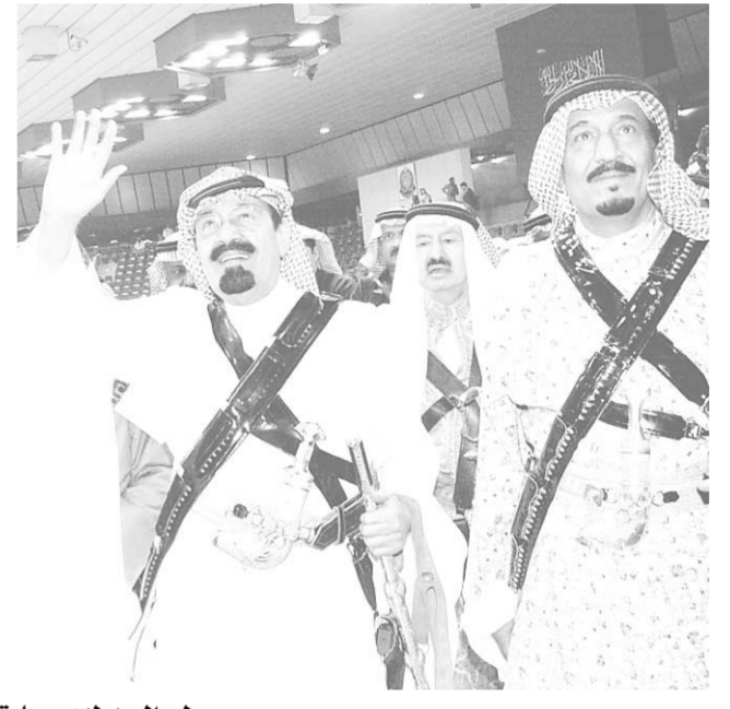
سمو ولي العهد لدى رعايته حفل العرضة السعودية في الجنادرية

والثقافة وذلك في صالة الالعاب الرياضية المغلفة بطريق الدرية. وكان في استقبال سموه لدى وصوله مقر الصالة صاحب السمو الملكي الامير سلمان بن عبدالعزيز أمير منطقة الرياض وصاحب السمو الملكي الامير سحام بن عبدالعزيز نائب أمير منطقة الرياض وصاحب السمو الملكي الفريق أول ركن متعب بن عبدالله بن عبدالعزيز نائب رئيس الحرس الوطني المساعد للشؤون العسكرية نائب رئيس اللجنة العليا للمهرجان الوطني للتراث