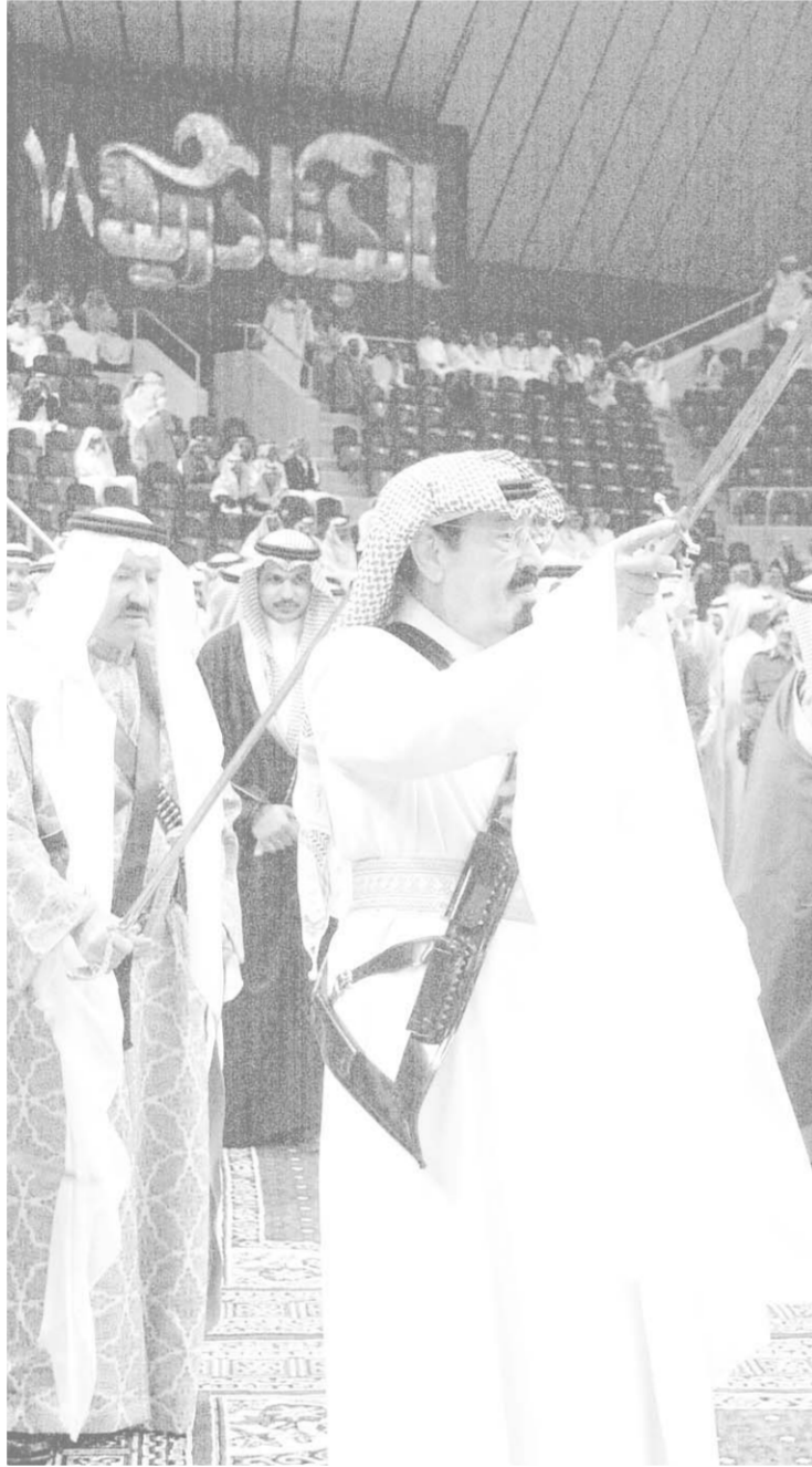
سموه يؤدي العرضة السعودية

لقد كانت النظرة الغربية الى العرب أنهم دعاة حرب وأنصار للعنف ويؤيد الوحشية والتخلف.. بيد أن الاحداث العالمية والاقليمية وتطوراتها أثبتت نقيض ذلك تماماً، بل أكدت أن من كانوا دعاة للحرية والديمقراطية ويطالبون بحقوق الشعوب في تقرير مصيرها وفي التمتع بحقوقها الانسانية، هم أول من خنق تلك الحريات وانتهك تلك الحقوق وحمل العصا، فقمع الشعوب باسم المصالح القومية، وشهر السيف فسلبها ثرواتها يحد قوى العولمة الاقتصادية وينصالح الحرية التجارية. لقد كنا ولا زلنا دعاة سلام واستقرار وأمان على الرغم مما أرتكب في منطقتنا من تجاوزات وما مورس ضدها من اضطهادات عسى أن يتغلب منطق الامن والسلام العالمي على منطق العنف والحرب الغربي.. ولكن كما يقال في الأعراف المتعارف عليها «أن للصبر حدوداً».. وتتمنى عكس ذلك.