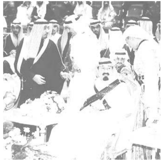
سموه يتابع فقرات احتفالية العرضة في المهرجان الوطني للتراث والثقافة

والثقافة وذلك في صالة الالعاب الرياضية المغلفة بطريق الدرية. وكان في استقبال سموه لدى وصوله مقر الصالة صاحب السمو الملكي الامير سلمان بن عبدالعزيز أمير منطقة الرياض وصاحب السمو الملكي الامير سحام بن عبدالعزيز نائب أمير منطقة الرياض وصاحب السمو الملكي الفريق أول ركن متعب بن عبدالله بن عبدالعزيز نائب رئيس الحرس الوطني المساعد للشؤون العسكرية نائب رئيس اللجنة العليا للمهرجان الوطني للتراث