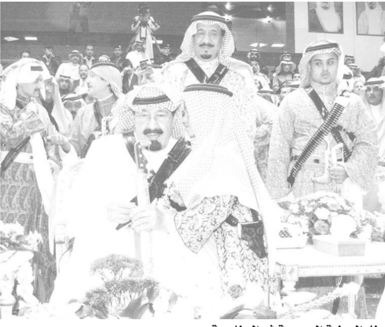
سمو ولي العهد لدى رعايته حفل العرضة السعودية في الجنادرية

عبدالله بن عبدالعزيز مكانه في المنصة الرئيسية للاحتفال بدأت العرضة السعودية. بعد ذلك شارك سمو ولي العهد في العرضة السعودية كما شارك فيها أصحاب السمو الملكي الامراء. ثم شرف صاحب السمو الملكي الامير عبدالله بن عبدالعزيز حفل العشاء الذي أقامته اللجنة العليا للمهرجان الوطني للتراث والثقافة، وحضر حفل العرضة السعودية وشارك فيها وحضر حفل العشاء صاحب السمو الملكي الامير متعب بن عبدالعزيز وزير الأشغال العامة