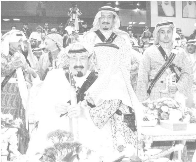
سمو ولي العهد لدى رعايته حفل العرضة السعودية في الجنادرية

عبدالله بن عبدالعزيز مكانه في المنصة الرئيسية للاحتفال بدأت العرضة السعودية. بعد ذلك شارك سمو ولي العهد في العرضة السعودية كما شارك فيها أصحاب السمو الملكي الامراء. ثم شرف صاحب السمو الملكي الامير عبدالله بن عبدالعزيز حفل العشاء الذي أقامته اللجنة العليا للمهرجان الوطني للتراث والثقافة، وحضر حفل العرضة السعودية وشارك فيها وحضر حفل العشاء صاحب السمو الملكي الامير متعب بن عبدالعزيز وزير الاشغال العامة