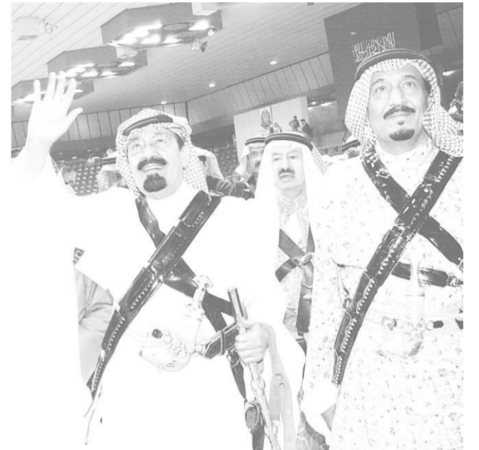
سمو ولي العهد لدى رعايته حفل العرضة السعودية في الجنادرية

والثقافة وذلك في صالة الالعاب الرياضية المغلفة بطريق الدرية. وكان في استقبال سموه لدى وصوله مقر الصالة صاحب السمو الملكي الامير سلمان بن عبدالعزيز أمير منطقة الرياض وصاحب السمو الملكي الامير سحام بن عبدالعزيز نائب أمير منطقة الرياض وصاحب السمو الملكي الفريق أول ركن متعب بن عبدالله بن عبدالعزيز نائب رئيس الحرس الوطني المساعد للشؤون العسكرية نائب رئيس اللجنة العليا للمهرجان الوطني للتراث