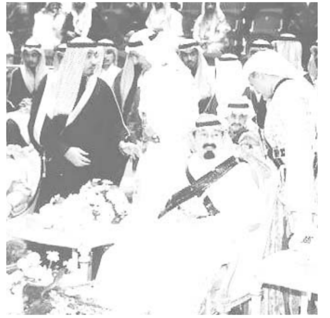
سموه يتابع فقرات احتفالية العرضة في المهرجان الوطني للتراث والثقافة