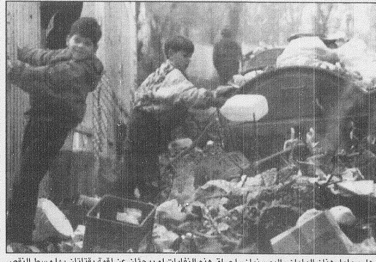
هل يحاول هذان الولدان «البوسنيان» احراق هذه الغنايات ام يبحثان عن لقمة يقاتلان بها وسط النقص المريع لكل الضروريات الاساسية في وطنهما؟

نوهاك رئيساً للروس انتخب نوهاك فومسانفان امين زعيماً للافلاس الروس في كاسيون فومبيين الذي تولى يوم السبت الماضي عن عمر يناهز ٧٢ عاماً. وقال راديو لاوس انه تم انتخاب نوهاك زعيماً للبلاد خلال جلسة خاصة للبرلمان.