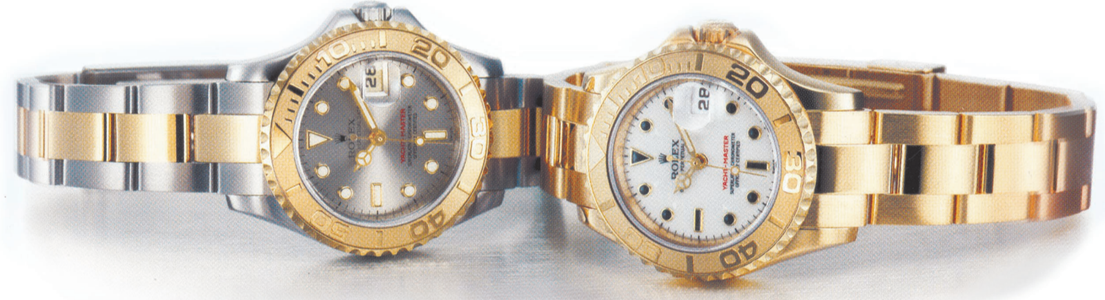
ساعتا رولكس يخت - ماستر - كرونو مترسويسري مضمون رسمياً.