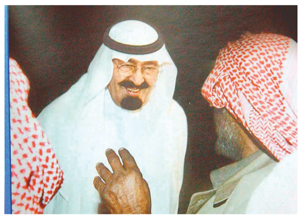
سموه يستمع باهتمام كبير وابتسامه عرضه ل احد المواطنين

تربيتها وتوفر المياه يسهل عملية افاقة المشاريع الزراعية.