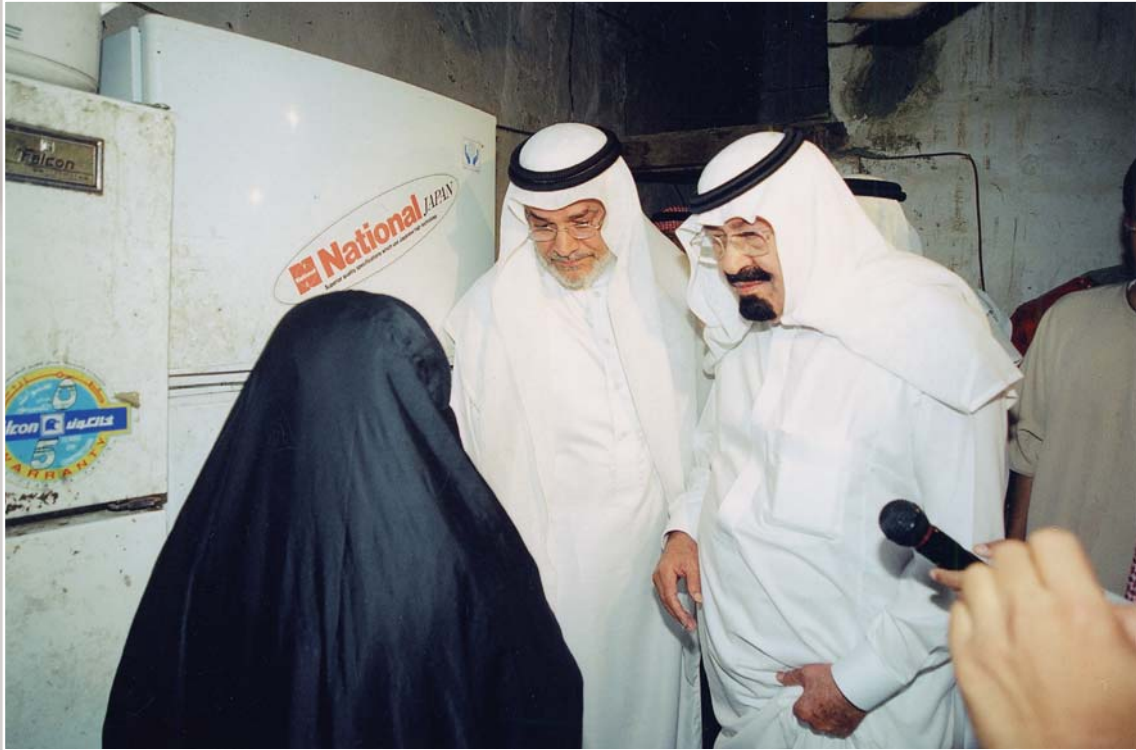
خادم الحرمين الشريفين يتفقد حال امرأة في أحد الأحياء القديمة بالرياض

موضوع الفقر، اقتصادياً واجتماعياً، ودعمه بالاستشارات، والإمكانيات، هما السبب في تحويل زيارته إلى حدث إعلامي يتفاعل معه الجميع، ليصبحوا شركاء في هم قضية الفقر والفقراء. ووجه - حفظه الله - فوراً بتنفيذ مبادرته الرامية إلى اجتثاث الفقر عبر خطة شاملة لعلاج الفقر، تتمثل في عدد من المحاور، منها: