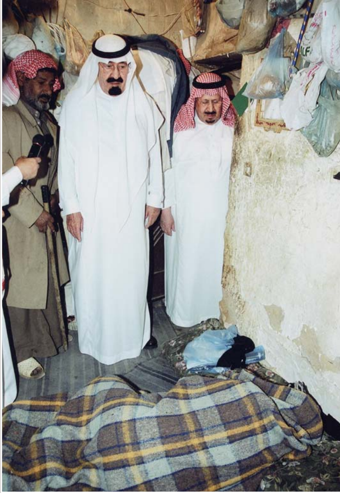
خادم الحرمين الشريفين يتفقد أحوال الفقراء والمحتاجين

وقد تجسد ذلك في زيارته لأمريكا عقب أحداث الحادي العشر من سبتمبر / أيلول ٢٠٠١م، عندما شاهد الأمريكيون، وهو يسير متجولاً في الأسواق، ويأكل في المطاعم الأمريكية الصغيرة؛ مما أعطى إشارة واضحة للرد على كل الحملات التي تحاول أن تلصق الإرهاب بالمسلمين، وأن تضع حواجز بين الإسلام والغرب في محاولة لتكوين صورة نمطية مشوهة عن الإسلام والمسلمين.