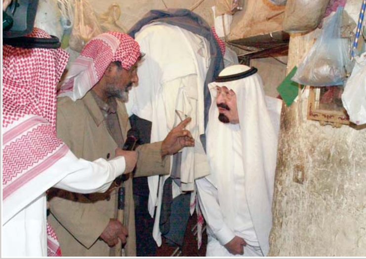
خادم الحرمين الشريفين يسأل أحد المواطنين عن حاله

وجدير بالذكر أن هناك الكثير من الجهات الرسمية ساهمت في دعم هذه المؤسسة، ومساندتها ممثلة في الجهات البلدية، ووزارة المياه والكهرباء، ووزارة النقل، والهيئة الملكية للجبيل وينبع، وغيرها. وفي سبيل تحقيق أهدافها بصورة شاملة استعانت المؤسسة بعدد من أساتذة الجامعات في التخصصات العمرانية والهندسية والاجتماعية، بالإضافة إلى توفير قاعدة متميزة للمعلومات تحوي بيانات شاملة للسكان المستهدفين قابلة للتحديث بشكل مستمر، وفقاً لما يطرأ على تلك الأسر من تغيرات في بياناتها الاجتماعية أو الاقتصادية، كما تتولى المؤسسة إدارة مشروعاتها كافة من خلال فرق هندسية مؤهلة، وباستخدام أحدث التطبيقات الهندسية في إدارة المشروعات.