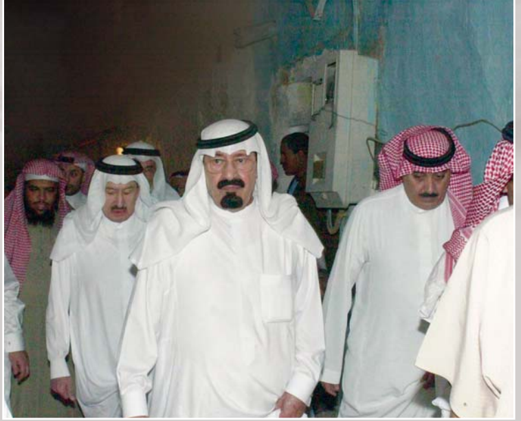
خادم الحرمين الشريفين يقوم بجولة تفقدية لبعض الأحياء القديمة في مدينة الرياض

وقد وضعت المؤسسة منذ بداية تأسيسها خطة إستراتيجية لتحقيق أهدافها المتمثلة في تصميم المشروعات الإسكانية الملائمة للبيئة المحلية، وإنشائها في المناطق الأكثر احتياجاً، وفقاً لمواصفات محددة تحقق التوازن بين التكلفة المناسبة وسهولة