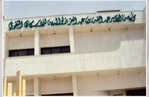
دار الإسكان التنموي التي أنشأها خادم الحرمين الشريفين برا بوالديه

وكان، ولازال، الملك عبد الله بن عبد العزيز يصر في زيارته على مشاركة الناس في حياتهم وبساطتهم، وعروضهم الشعبية التي تقام احتفالاً بمقدمه الميمون، حتى إن الأمير خالد الفيصل أمير منطقة عسير - حفظه الله - وصف صعوبة الموقف شخصياً عندما أصر الملك عبد الله على المشاركة في العرضة الجنوبية،