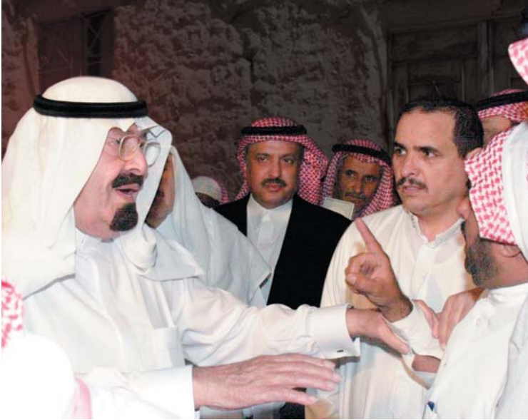
خادم الحرمين الشريفين حريص على الاستماع للمواطنين

وتواصل اهتمام خادم الحرمين الشريفين بإصداره أمره الكريم بإجراء عملية لسيدة سعودية للتخفيف من معاناتها من الزيادة الكبيرة في الوزن، حتى تتعم بممارسة