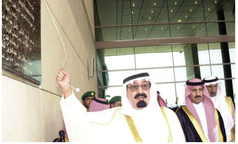
خادم الحرمين الشريفين يرفع افتتاح مدينة الأمير سلطان للخدمات الإنسانية ( واس )

السمنة المفرطة التي تجاوزت ١٨٠ كيلو جراماً، بقيادة المدير الإقليمي التنفيذي للشؤون الصحية في الحرس الوطني في القطاع الشرقي الدكتور أحمد عبد الرحمن العرفج، تمهيداً لإجراء عملية جراحية لتخفيف وزن السيدة، وقال العرفج: إن مدينة الملك عبدالعزيز الطبية في الرياض في مثل هذه الحالات تقوم بإجراء التحاليل اللازمة، وفور وصول المريض إلى المستشفى يتم إجراء الفحوصات السريرية والتشخيصية المكثفة لمختلف أعضاء الجسم لتحديد العملية الجراحية، باستخدام المنظار، ودون حاجة إلى إجراء جراحة فتح البطن، وقد أبدى العرفج تفاؤله بنجاح مثل هذه العمليات بدرجة عالية من النجاح، معتمداً، في ذلك على الله أولاً، ثم على الدعم والتشجيع والمتابعة المستمرة من خادم الحرمين الشريفين الملك عبد الله بن عبد العزيز، حفظه الله.