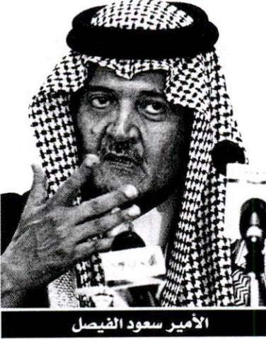
الأمير سعود الفيصل