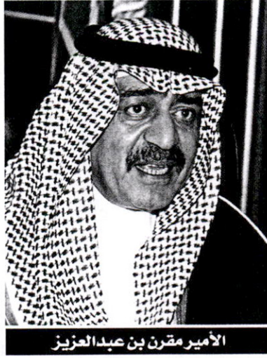
الأمير مقرون بن عبدالعزيز