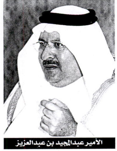
الأمير عبد المجيد بن عبدالعزيز