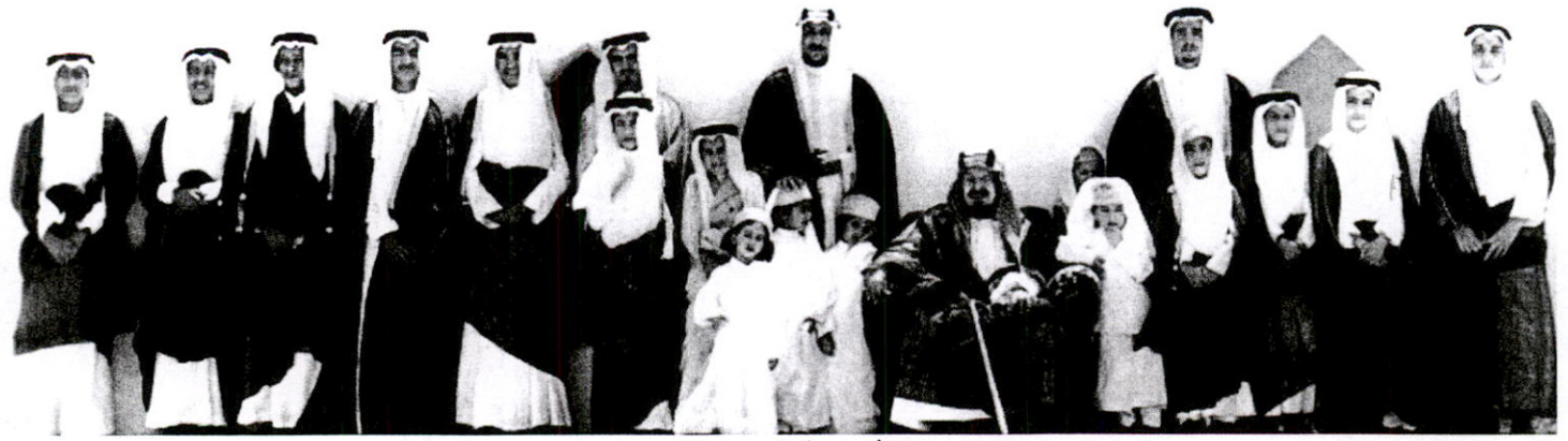
المؤسس والأبناء .. أساس متين وكفاح متصل