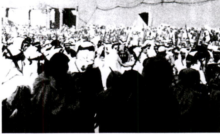
الملك عبد العزيز قبل ٧٦ عاماً؛ أرجو أن يجمع الله كلمة