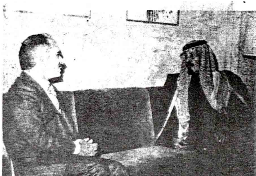
● سمو ولي العهد مع جلالة الملك حسين ملك الأردن