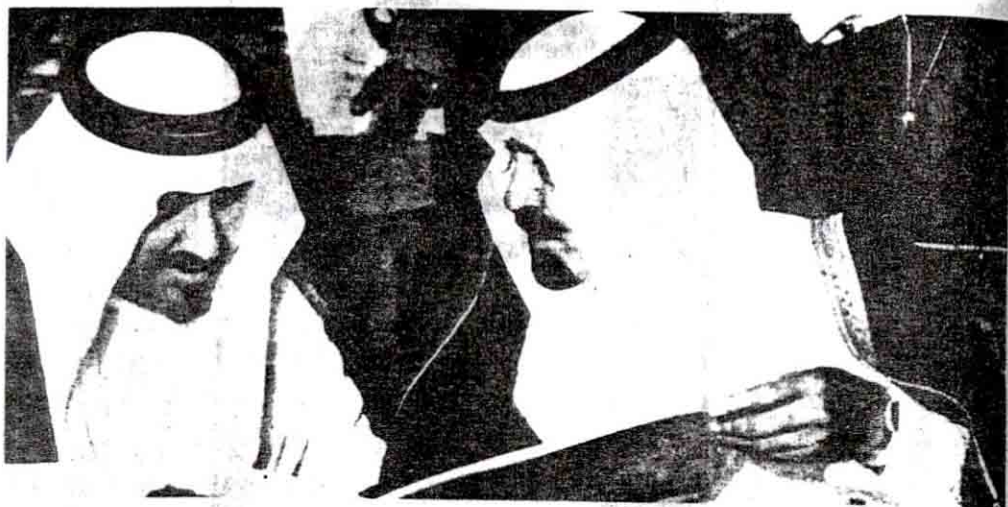
● سمو ولي العهد مع النائب الثاني ووزير الدفاع والطيران سمو الامير سلطان بن عبد العزيز

الأشقاء مستهدفاً توحيد الصف ووحدة الكلمة في مواجهة التحديات الاسرائيلية والاستعمارية والدولية التي تواجه الأمة العربية والاسلامية.. وكان من أبرز جولات سموه في هذا الميدان الرحب سلسلة الزيارات التي قام بها سموه لكل من سورية والعراق والاردن من أجل العمل على تعزيز الجبهة الشرقية وتقوية الفرصة على الأعداء للنفوذ الى صفوف الأشقاء ، كما قام سموه بزيارة رسمية لمختلف الدول المتقدمة ، والنامية كالولايات المتحدة الامريكية والدول الاوربية والدول العربية والافريقية .