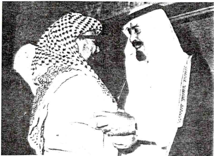
● سمو ولي العهد مع السيد ياسر عرفات رئيس منظمة التحرير الفلسطينية

وهكذا قاد سموه هذا العرس الوطني قيادة حكيمة بناءة وقام بتدريبه تدريجياً واسعاً فريداً وجعل منه مؤسسة حضارية زاخرة . وقد كان اختيار سموه لهذا المنصب نقطة ايجابية كبيرة بارزة في حياة وتطور هذا القطاع من القوات السعودية المسلحة .