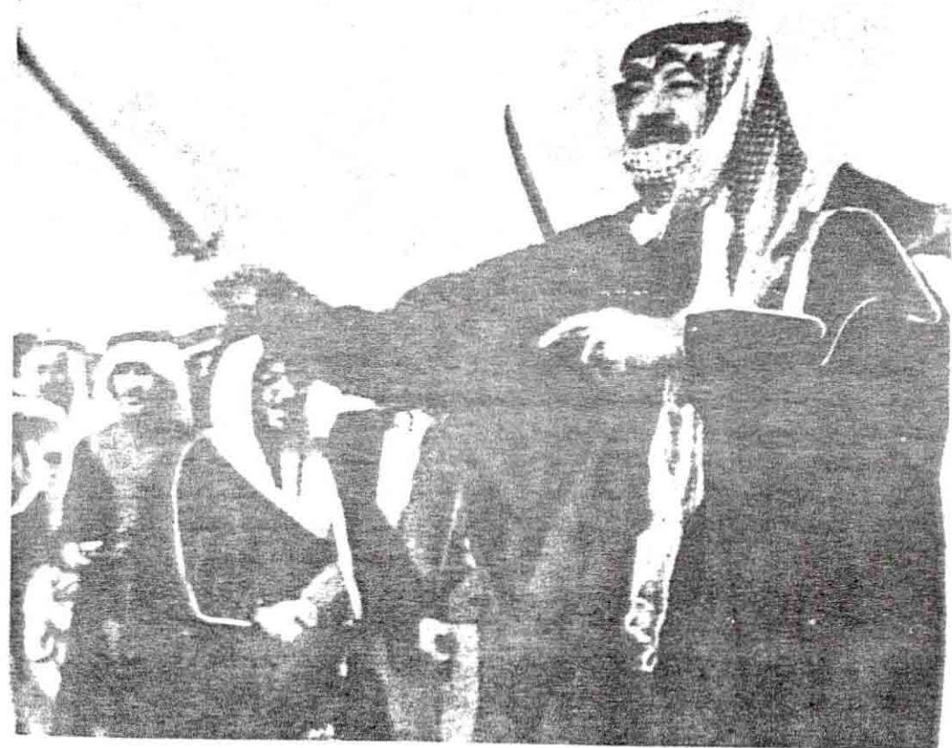
● سمو ولي العهد واصالة فروسية البادية