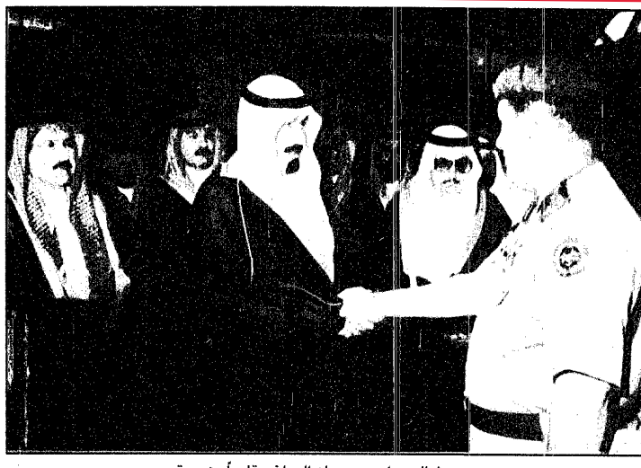
سمو ولي العهد لدى وصوله الرياض قادما من جدة

ليون دولار مصر للتسامحة في تخفيف آلام خصايها الهزة الأرضية صدى إيجابيا... محمود جبر الذي أشار إلى أكثر من عشرة آلاف جريح وردا على الحصيلة الرسمية المؤقتة التي أدلى بها رئيس الوزراء المصري الدكتور عاطف صدقي والتي تحدثت عن ٣٨٦ قاتلا و٣٨٦ جرحا قاتلا دون أن يذكر أياها ولكن حصيلة الاتحاد هي ألف قتيل... في القاهرة والمدن المصرية رغم التوجس والحذر من حدوث هزات أخرى.