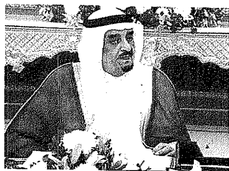
خادم الحرمين الشريفين يرأس جلسة مجلس الوزراء