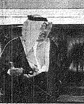
مفتي وعدد من كبار المشائين في وزارة الاعلام المصرية

عكاظ-الاستماع، واس-القاهرة وصف معالي الدكتور فراد الفارسي وزير الاعلام وزيارته للقاهرة بانها كانت ناجحة وانها استهدفت ترسيخ العلاقات بين وزارتي الاعلام في المملكة ومصر وهي العلاقات التي تمكن من الاصحاح بين الشعبين الشقيقين، وقال معالي الدكتور الفارسي في تصريح ابدى به لسي معادرت القاهرة امس واريدته وكافة ابناء الشرق الاوسط انه لم يكن هناك جدول معين للزيارة مشيرا الى انها تساهلت بالحوارات السعودية-المصرية والعربية-العربية والاسلامية وبحث القضايا المشتركة. من جانبها قال معالي وزير الاعلام المصري صوفت الشريف ان زيارة معالي الدكتور الفارسي كانت ناجحة على كافة الصعد، هذا وقد غادر معالي الدكتور الفارسي القاهرة ظهر امس بعد زيارة سعيدة استمرت اسبوعا، وكان في رواد معاليه في المطار معالي وزير الاعلام المصري صوفت الشريف والقائم باعمال سفارة خادم