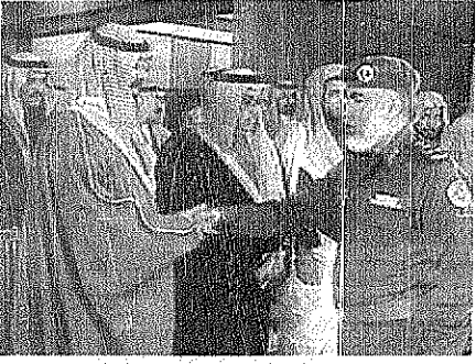
سمو ولي العهد اثناء استقباله كبار الضباط

واس- مدينة الملك خالد العسكرية استقبال صاحب السمو الملكي الامير عبدالله بن عبدالعزيز ولي العهد ونائب رئيس مجلس الوزراء ورئيس الحرس الوطني في نادي الضباط بالمضافة العسكرية في مدينة الملك خالد العسكرية أمس جمعا من المواطنين وكبار قادة وضباط المنطقة الشمالية الذين قدموا للسلام على سموه وتوثقت بهدية الفطر المبارك، وقد رحب سموه خلال الاستقبال بالجميع ونقل اليه تهاني خادم الحرمين الشريفين الملك فهد بن عبدالعزيز آل سعود والشاهات الاعلى القوات المسلحة بعيد الفطر المبارك، وقد عبر الجميع عن شكرهم وتقديرهم لسمو ولي العهد على هذه اللقطة الكريمة وتناول الجميع طعام الغداء على مأدبة سموه، من جهة ثانية بعث صاحب السمو الملكي الامير عبدالله بن عبدالعزيز ولي العهد ونائب رئيس مجلس الوزراء ورئيس الحرس الوطني برفقة تهنئة لجلالة الملك الحسن الثاني ملك المملكة المغربية بمناسبة ذكرى اليوم الوطني لبلاده، واعرب سمو ولي العهد عن ابلغ التهاني واخص التمنيات الاخوية بدوام الصحة والسعادة لجلالة الملك الحسن الثاني والتقدم المستمر والازدهار الدائم لشعب المغرب الشقيق.