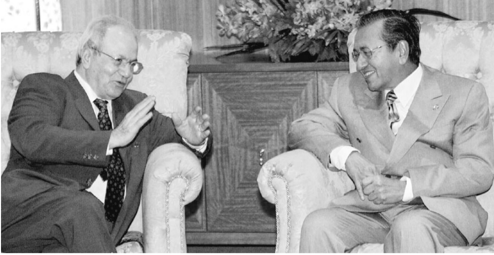
رئيس الوزراء الماليزي يتحدث الى فاروق القدومي رئيس الوفد الفلسطيني على هامش القمة الإسلامية في ماليزيا

فهميم الحامد (موفد عكاظ الى القمة الإسلامية)