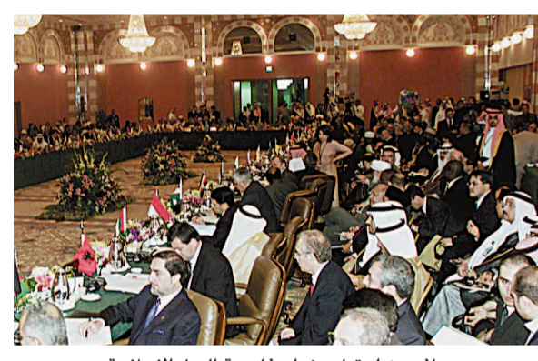
جانب من اجتماع وزراء خارجية الدول الإسلامية

علمت «عكاظ» أن إيران تقدمت بوجهة نظر طالبت من خلالها إجراء مناقشة مشروع الخطة العشرية لتطوير منظمة المؤتمر الإسلامي إلى دورة القمة القادمة المقررة في السنغال بهدف المزيد من الدراسة والاطلاع مع تأكيدها على أهمية هذه الخطة وعدم الاعتراض عليها من حيث المبدأ. ولكن وزراء الخارجية المشاركين في اجتماع أمس أصرروا على ضرورة الاستمرار في مناقشتها والبت فيها وتقديمها للقادة في قمة اليوم.