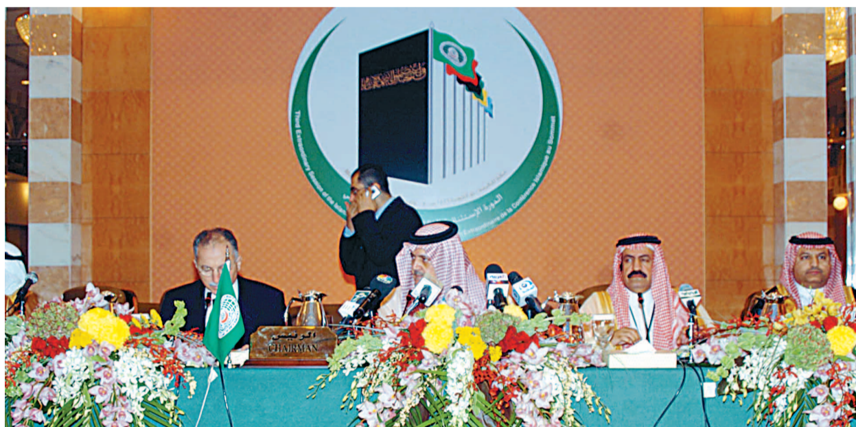
سمو وزير الخارجية وأمين منظمة المؤتمر الإسلامي أثناء الجلسة الافتتاحية للاجتماع الوزاري، أمس

بعث خادم الحرمين الشريفين الملك عبدالله بن عبدالعزيز آل سعود حفظه الله برقية تهنئة لجلالة الملك خوان كارلوس الاول ملك اسبانيا بمناسبة مرور ثلاثين عاما على تنويع جلالتة ملكا لاسبانيا. (ص ٣)