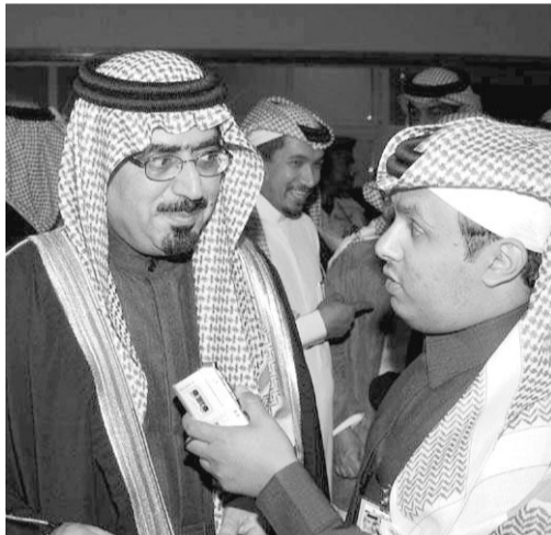
الأمير خالد يتحدث لـ «عكاظ»

اعرب صاحب السمو الامير خالد بن سعود شاعر اوبريت «عربين الأسد» عن جزيل شكره لخادم الحرمين الشريفين وسمو ولي العهد على اعطائه هذه الفرصة لتأليف اوبريت الجنادرية. وأكد سموه لـ«عكاظ» ان الامير عبدالله بن عبدالعزيز كان راضياً عن الأوبريت عقب الانتهاء من عرضه وقال: نحن نشكر سموه