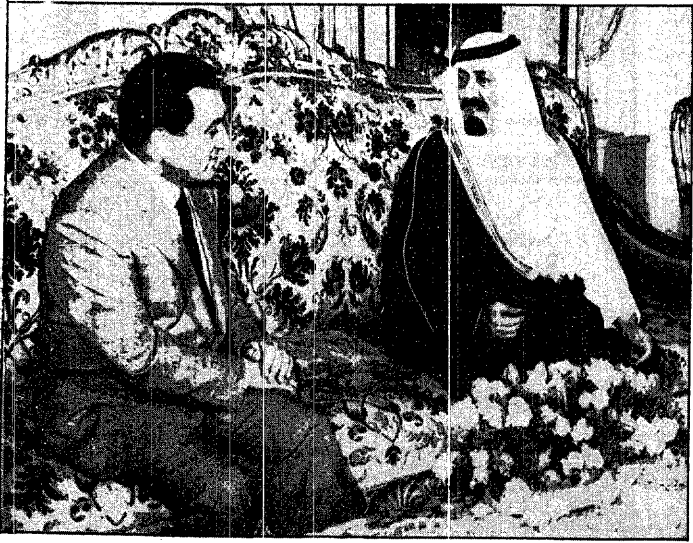
الرئيس مبارك يستقبل سمو الأمير عبدالله بن عبدالعزيز بالقاهرة

كتب المحرر السياسي: حظيت الجولة التي قام بها صاحب السمو الملكي الأمير عبدالله بن عبدالعزيز ولي العهد ونائب رئيس مجلس الوزراء ورئيس الحرس الوطني إلى كل من سوريا ومصر والمغرب باهتمام ومتابعة دولية وعربية كبيرة. فقد اكتسب هذا التحرك السعودي الرفيع المستوى أهمية مضاعفة بحكم المرحلة التي تمر بها المنطقة حالياً وبحكم التوجهات السياسية للمملكة في الفترة الأخيرة في ضوء الرؤية الشاملة لأحداث المنطقة والتي طرحها خادم الحرمين الشريفين الملك فهد بن عبدالعزيز بوضوح كامل منذ المراحل الأخيرة لحرب تحرير الكويت. وقبل كل ذلك فإن مكانة صاحب السمو الملكي الأمير عبدالله بن عبدالعزيز أضفت معانٍ خاصة وإبعادا متميزة حول هذه الجولة والنتائج المتوقعة منها.