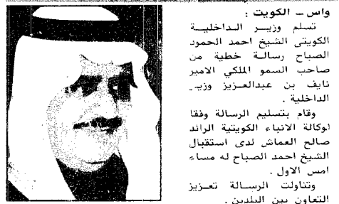
سمو الامير نايف

واس - جدة : رحب مجلس الوزراء بالتوجيهات السامية من خادم الحرمين الشريفين الملك فهد بن عبدالعزيز بوضع نظامي الشورى والمناطق موضع التنفيذ في اسرع وقت ممكن. وأشار المجلس في جلسته التي رأسها صاحب السمو الملكي الأمير عبدالله بن عبدالعزيز ولي العهد نائب رئيس مجلس الوزراء ورئيس الحرس الوطني.