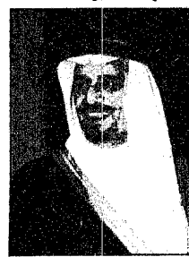
سمو الامير سلمان

حسين حجاجي - مدريد : أكد صاحب السمو الملكي الامير سلمان بن عبدالعزيز - أمير منطقة الرياض - ان خادم الحرمين الشريفين قد رعى مشروع المركز الثقافي الاسلامي في مدريد منذ البداية انطلاقاً من إيمانه الراسخ بمقيدة أمنا ورسالتها الخالدة ويتألم شعنا الأصيلة وما للعلاقات المتميزة مع اسبانيا حكومة وجمعا. وأوضح سموه في كلمته التي ألقاها بتكليف من خادم الحرمين الشريفين - أثناء افتتاحه المركز مساء امس - ان المركز رمز ثقافي يتعاقب فيه عهد الماضي وواقع الحاضر وامل المستقبل. وأكّد سموه على ان الثقافة كون كويتي تعدي لا تتحقق معانيه دون التعاون البشري وان السلام متعة رب العالمين منذ الازل لجميع مخلوقاته وان العدل أساس التعايش الانساني. وأشار سموه الى ان المركز صرح حضارى وشعلة اشعاع يتم نورهما الناس جميعا كما ان مديره يمثل فيه البعد الثقافي والصداقة التاريخية بين المملكة واسبانيا. وكرر سموه على ان اختيار اسبانيا لاقامة المركز لم يكن عشوائيا بل استند على اساس من الامان الثابت باصالة العلاقات مع اسبانيا. ومن جانبه قال المعالج الاسباني الملك خوان كارلوس في كلمته في حفل الافتتاح: انه ليوم رائع ان تشهد مدريد افتتاح المركز الثقافي الاسلامي مؤكدا انه سيعمل دائما لقطعته اسبانيا على نفسها من الحفاظ على التراث الاسلامي. « التفاصيل ص ١١ »