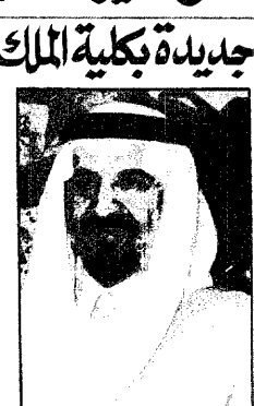
سمو الامير سلطان

محمد الغامدي « الرياض : يرعى صاحب السمو الملكي الامير سلطان بن عبدالعزيز النائب الثاني لرئيس مجلس الوزراء وزير الدفاع والطيران والمفتش العام حفل تخريج دفعة جديدة من طلبة كلية الملك فيصل الجوية صباح غد الاربعاء بالرياض . وقد اعرب صاحب السمو اللواء طيار ركن محمد بن عبدالله بن محمد ال سعود قائد الكلية عن سعاده الفعارة بتخريج سمو النائب الثاني وريعايته للحفل وقال في مؤتمر صحفي عقبه ظهر امس بمقر الكلية ان قدوم سموه الكريم لتهنئة اخبر وسام لمنسوبي الكلية وطلابها مشيراً الى انه من نوعي الفرح والغبطة ان تقتنر هذه المناسبة بفرحة اعم الا وهي احتفالات ابناء المملكة باليوم الوطني. وأشار سمو اللواء طيار ركن محمد بن عبدالله الى ان الكلية استقبلت خلال العامين الماضيين اعداداً كبيرة من الطلاب تفوق الاعداد الماضية وذلك بتوجيهات واورام كريمة من سمو النائب الثاني . وحول صفقة طائرات اف ١٥ التي ستحصل عليها المملكة قال سموه ان دخول منظومات حديثة للقوات الجوية الملكية السعودية سيكون مردودها ايجابياً بلا شك نظراً لمكانة المملكة ونتيجة لكبر مساحتها ولا شك ان وجودها ضروري خاصة وان القوات الجوية تأتي في طليعة اهتمامات المستثمرين بالمملكة. من جهة اخرى وصل الى الرياض مساء امس بحفظ الله وريعايته صاحب السمو الملكي الامير سلطان بن عبدالعزيز وزير الدفاع والطيران والمفتش العام قادماً من جدة . « تفاصيل ص ٤ »