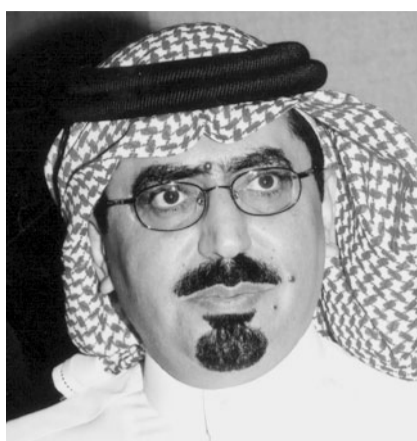
الأمير خالد بن سعود الكبير