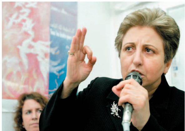
شيرين أثناء اللقاء، كلمتها

د. عثمان عبده هاشم (تونس) أكدت السيدة شيرين عبادي ممثلة المجتمع المدني والفخرية الدولية لحقوق الانسان والايرانية الحائزة على جائزة نوبل خلال الجلسة الافتتاحية للقمة العالمية حول مجتمع المعلومات والتنمية والسير على درب التقدم. وأشارت الى ان الفجوة الرقمية الراهنة بين الدول الصناعية والبلدان النامية من شأنها أن تؤدي الى تفاقم الهوة بين الشعوب الغنية والفقيرة مبيحة ان ارساء مجتمع المعلومات بقر ما مثل فرصة ثمينة امام البشرية لتحسين مستوى عيش المواطن فإنه في المقابل ادى الى هشاشة البلدان