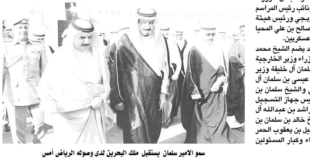
سوم الامير سلمان يستقبل ملك البحرين لدى وصوله الرياض أمس

على محاضرة عن برامج التعليم وماكبها لاحتياجات سوق العمل. فيما تتناول المحاضرة الثانية القطاع الخاص ودوره في التدريب والتوظيف. كما تتناول المحاضرة الثالثة العلاقة بين الواقع والمأمول وتتناول المحاضرة الرابعة رؤية مستقبلية لدور الحج والعمرة في توفير الفرص الوظيفية. اما المحاضرة الخامسة فتعنى بالتوظيف الجامعي بين الواقع والمأمول. فيما تتناول المحاضرة السادسة السادة القطاع الخاص ودوره في التدريب والتوظيف النسائي. وبين مدير الجامعة ان عدد المشاركين في يوم المهنة الثاني اكثر من ٥٠٠ جهة من القطاع الحكومي والخاص. كما بلغ عدد الجهات الداعمة لفعالياته ١٧ جهة حكومية واهلية كما بلغ عدد الجهات المضاربة بالفرض الوظيفية ٢٥ جهة حكومية واهلية اكثر من ٣ الاف وظيفة ويصاحب فعاليات يوم المهنة اقامة معرض يشتمل على العديد من المعارض المعروضات التي تقدمها اكثر من ٣٥ جهة حكومية واهلية. وفي ختام تصريحه اعرب مدير جامعة ام القرى المكلف الدكتور ناصر بن عبدالله الصالح عن شكره وتقديره لسوم الأمير نايف بن عبدالعزيز على رعاية سموه ليوم المهنة.