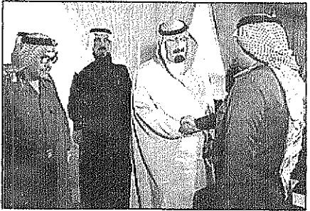
سمو ولي العهد يستقبل كبار قادة الحرس الوطني

سمو ولي العهد يستقبل المواطنين وكبار قادة وضباط حرس الحدود والحرس الوطني السعودية - الرياض: استقبل صاحب السمو الملكي الأمير عبدالله بن عبدالعزيز ولي العهد نائب رئيس مجلس الوزراء ورئيس الحرس الوطني في مكتب سموه برئاسة الحرس الوطني كبار قادة وضباط حرس الحدود والحرس الوطني واستقبل سمو ولي العهد الفريق محجب القطامي مدير عام حرس الحدود واستقبل صاحب السمو الملكي الأمير عبدالله بن عبدالعزيز في مكتبه برئاسة الحرس الوطني كبار قادة وضباط الحرس الوطني بتقديم الفريق أول ركن محمد عبدالله الحويش رئيس الجهاز العسكري بالحرس الوطني وقد هذا التجمع سمو ولي العهد يسلمه عونه الى المملكة وشهده ومشاراً بالسيارات وحضر اللقاءات محلي المستشار في الديوان الملكي الأستاذ ناصر الشاذلي