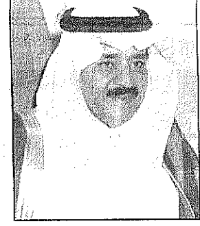
الامير نايف بن عبدالعزيز

كتب - أمن حبيب: نوه صاحب السمو الملكي الأمير نايف بن عبدالعزيز وزير الداخلية بالخدمات المتميزة التي قدمت لزوار والمعتمرين في مكة المكرمة والمدنية المنورة طيلة شهر رمضان.. وأشاد سموه بوجه خاص بدور هذه الخدمات في تسهيل على الزوار والمعتمرين في المناسك الأواخر من رمضان حيث تشهد الأماكن المقدسة كثافة بشرية هائلة. وقال سموه من الطبيعي ان يتدفق الناس على مكة المكرمة في المناسك الأواخر.