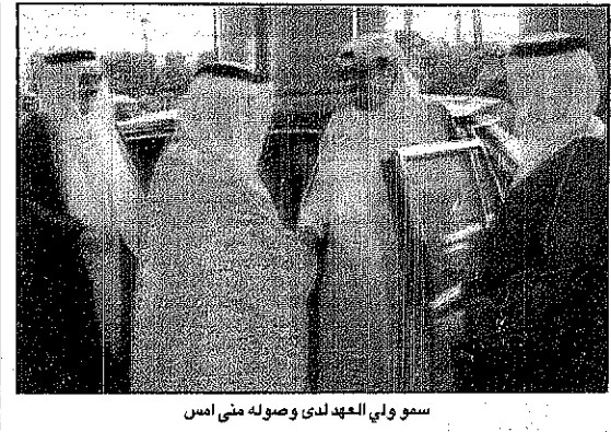
سمو ولي العهد لدى وصوله منى امس

السعودية - عرفات، اعرب صاحب السمو الملكي الأمير ماجد بن عبدالعزيز أمير منطقة مكة المكرمة رئيس لجنة الحج المركزية عن شكره لعمالي وزير الحج والعمرة الدكتور محمود بن محمد سفر والمطوفين ومسؤولي مؤسسات الطوافة الذين شاركوا بجهودهم المخلصة في إعادة تجهيز مخيمات الحجاج التي تضررت من حداث الحريق صباح يوم الأحد الماضي في منى، وقال سموه في برقية بعثها لعمالي وزير الحج والعمرة تعازين وتكاتف الجميع بالتعامل مع هذا الحدث الطارئ ودلت جميعا على صدق تواجدهم وإخلاصهم وحسن أدراكمهم لاسمائكم الوطنية وتفاؤلكم في خدمة دينكم ووطنكم، وأضاف سموه قائلا: «وانتم بصدركم هذا تؤكدون حرصكم على تحقيق هدف خدمة حجاج بيت الله الحرام وتمكينهم من أداء شعائر الحج والعبادة براحة وأمن وسرور والطمأنينة انفاذا لتوجيهات مولاي خادم الحرمين الشريفين وولي عهده الأمين وحكومته الرشيدة. وقد اعرب عمالي وزير الحج عن شكره وتقديره لصاحب السمو الملكي الأمير ماجد بن عبدالعزيز على مشاعره المخلصة ومتابعته المصيبة لكل مايشعل بالحج والتي كان لها الأثر الجيد في دفع عجلة إعادة نصب الخيام.