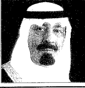
بسم الله الرحمن الرحيم

استقبل صاحب السمو الملكي الامير عبدالله بن عبدالعزيز ولي العهد ونائب رئيس مجلس الوزراء ورئيس الحرس الوطني في مكتبه في الديوان الملكي بقصر اليمامة بعد ظهر امس مندوب المفوضية السامية للاجئين للاجئين عبدالمولى الصلح. وقد رفع الاستاذ عبدالمولى الصلح شكره وامتنانه لخادم الحرمين الشريفين الملك فهد بن عبدالعزيز آل سعود وسمو ولي العهد لما تقدمه المملكة العربية السعودية من اسهام ودعم لشؤون اللاجئين في مختلف انحاء العالم. وبادان بالود والاسان الذي تضطلع به المملكة وبامتياز من خير لمساعدة اللاجئين ودرورها في دعم المفوضية السامية للاجئين وحضر الاستقبال معالي المستشار في ديوان سمو ولي العهد الاستاذ عبدالرحمن التويجري.