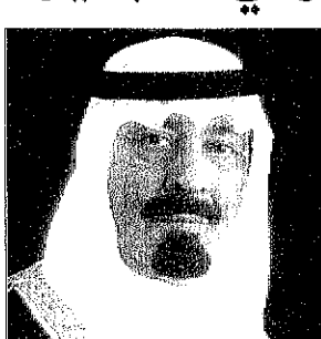
بسم الله الرحمن الرحيم

استقبل صاحب السمو الملكي الامير عبدالله بن عبدالعزيز ولي العهد ونائب رئيس مجلس الوزراء ورئيس الحرس الوطني في مكتبه في الديوان الملكي بقصر اليمامة بعد ظهر امس مندوب المفوضية السامية للاجئين الامير عبدالمولى الصلح. وقد رجع الامير عبدالمولى الصلح شكره وامتنانه لخادم الحرمين الشريفين الملك فهد بن عبدالعزيز آل سعود وسمو ولي العهد لما تقدمه المملكة العربية السعودية من اسهام ودعم لشؤون اللاجئين في مختلف انحاء العالم. واثم الامير عبدالله بن عبدالعزيز الذي تصطلع به المملكة واستقبلته من خير لمساعدة اللاجئين وودورها في دعم المفوضية السامية للاجئين المتحددة وحضر الاستقبال معالي المستشار في ديوان سمو ولي العهد الامير عبدالمحسن التويجري.