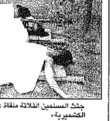
جثث المسلمين الثلاثة ملقاة على قارة الطريق في مدينة «شرار» الكشميرية»