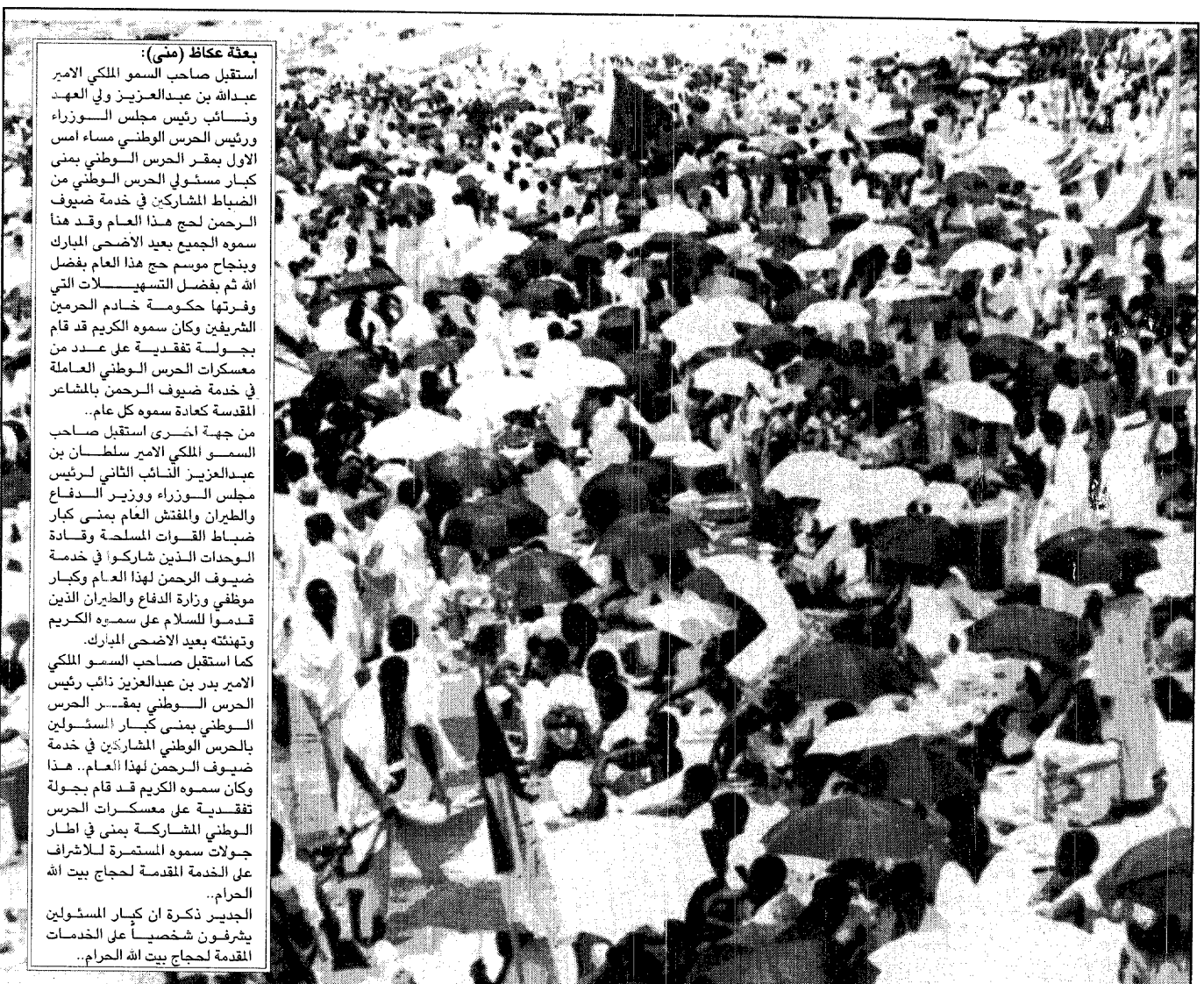
ضيوف الرحمن باختلاف الوانهم واجناسهم بزى واحد مهلبين ومكبرين.

بعثة عكاظ (مني): استقبل صاحب السمو الملكي الأمير عبدالله بن عبدالعزيز ولي العهد ونائب رئيس مجلس الوزراء ورئيس الحرس الوطني مساء أمس الأول بمقر الحرس الوطني بمني كبار مسئولى الحرس الوطني من الضباط المشاركين في خدمة ضيوف الرحمن لحج هذا العام وقد هنا سموه الجميع بعيد الأضحى المبارك وينجاح موسم حج هذا العام بفضل الله ثم بفضل التسهيلات التي وفرتها حكومة خادم الحرمين الشريفين وكان سموه الكريم قد قام بجولة تفقدية على عدد من معسكرات الحرس الوطني العاملة في خدمة ضيوف الرحمن بالمشاعر المقدسة كعادة سموه كل عام. من جهة أخرى استقبل صاحب السمو الملكي الأمير سلطان بن عبدالعزيز النائب الثاني لرئيس مجلس الوزراء وزير الدفاع والطيران والمفتش العام بمني كبار ضباط القوات المسلحة وقادة الوحدات الذين شاركوا في خدمة ضيوف الرحمن لهذا العام وكبار موظفي وزارة الدفاع والطيران الذين قدموا للسلام على سموه الكريم وتهنئته بعيد الأضحى المبارك. كما استقبل صاحب السمو الملكي الأمير بدر بن عبدالعزيز نائب رئيس الحرس الوطني بمقر الحرس الوطني بمني كبار المسئولين بالحرس الوطني المشاركين في خدمة ضيوف الرحمن لهذا العام. هذا وكان سموه الكريم قد قام بجولة تفقدية على معسكرات الحرس الوطني المشاركة بمني في إطار جولات سموه المستمرة للإشراف على الخدمة المقدمة لحجاج بيت الله الحرام. الجدير ذكره ان كبار المسئولين يشرفون شخصياً على الخدمات المقدمة لحجاج بيت الله الحرام..