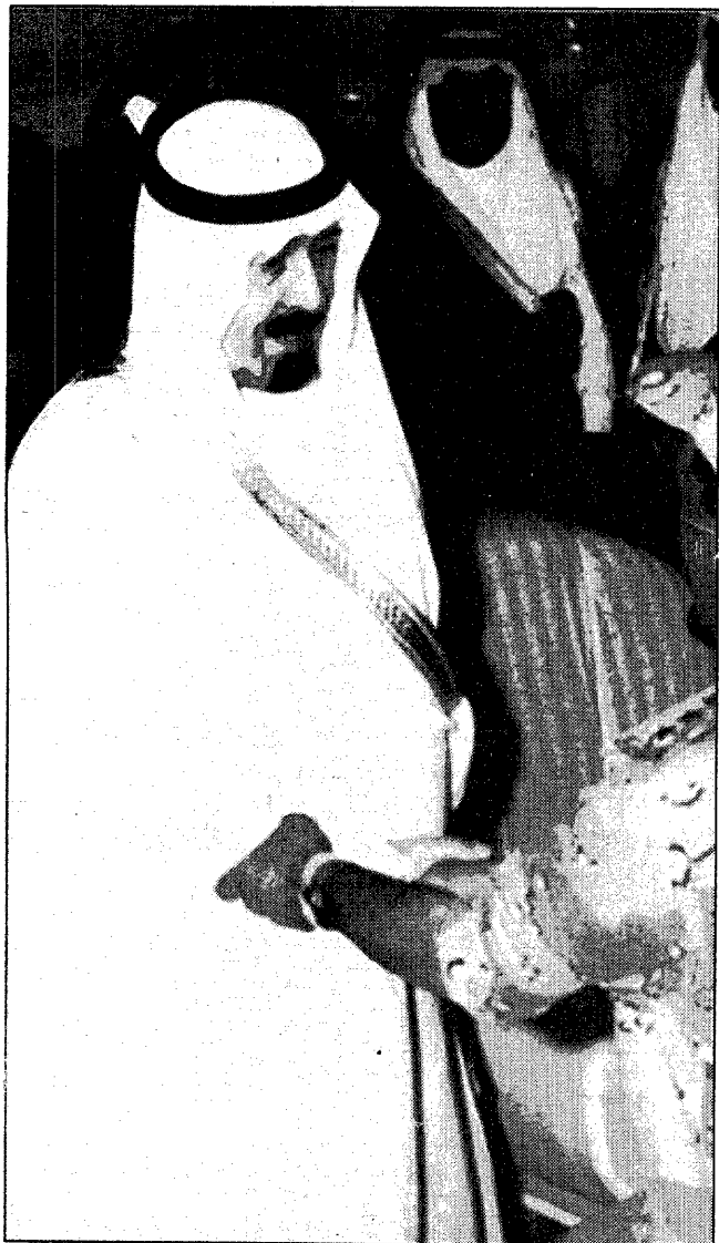
سمو ولي العهد ونائب رئيس مجلس الوزراء ورئيس الحرس الوطني يستقبل كبار ضباط الحرس الوطني.