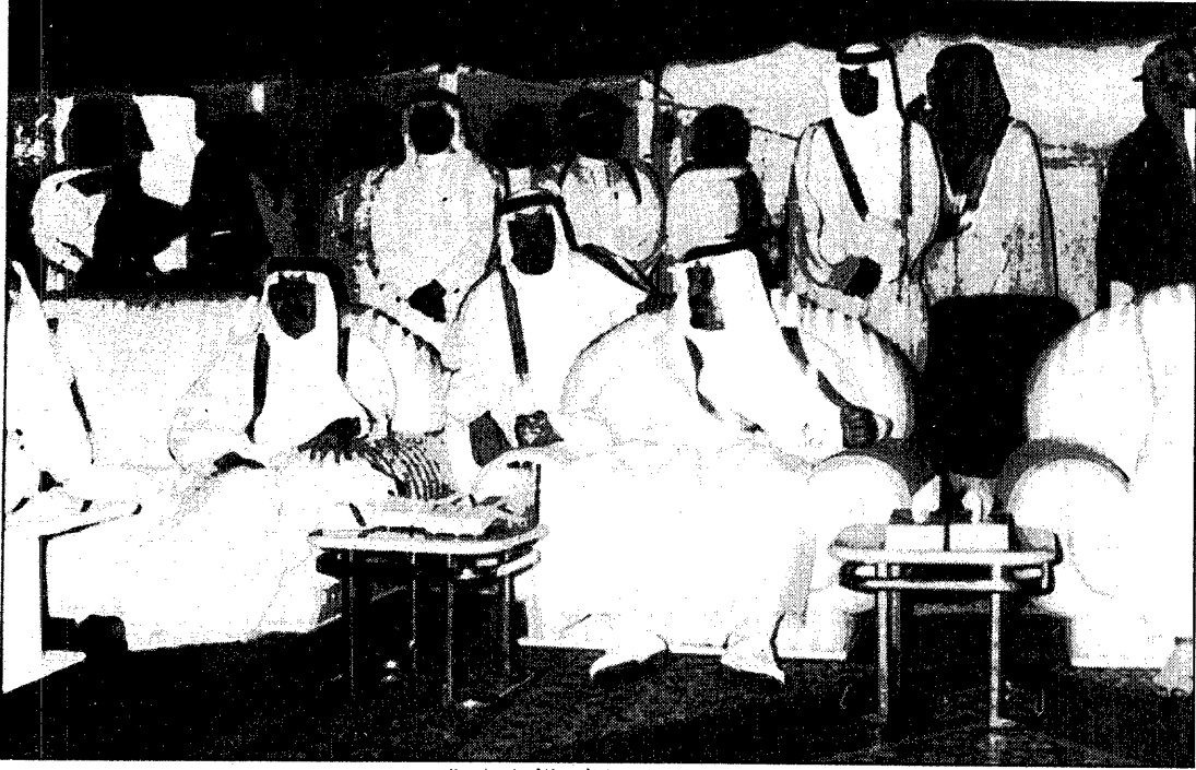
سمو ولي العهد والي جانبه الأمير نواف وخلفهما يجلس الأمير بدر.