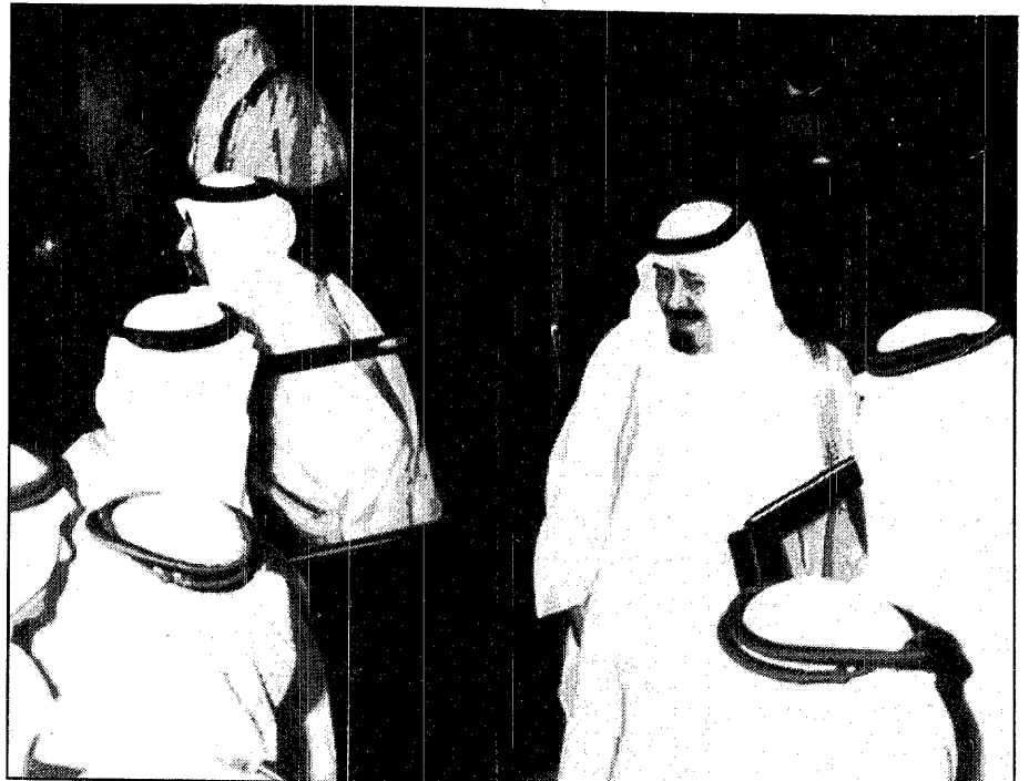
سمو الأمير عبدالله والأمير متعب لدى وصولهما مقر الحرس الوطني بمني.