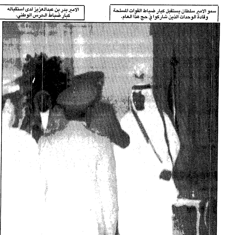
الأمير بدر بن عبدالعزيز لدى استقباله كبار ضباط الحرس الوطني.