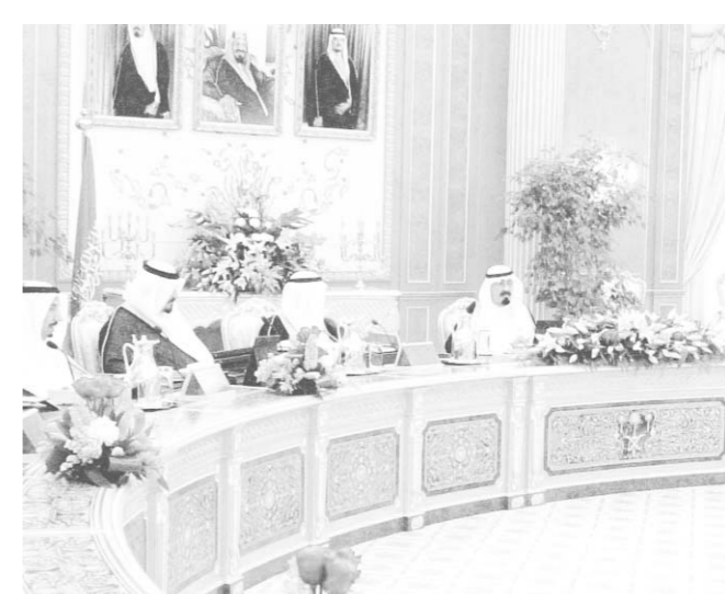
سمو ولي العهد يرأس جلسة مجلس الوزراء

اعضاء في مجلس ادارة هيئة تنظيم الخدمات الكهربائية لمدة ثلاث سنوات: الدكتور عبدالعزيز بن سليمان الطرياق، الدكتور محمد سالم بن عبدالله بن سرور الصبان، المهندس عادل بن محمد عبدالقادر فقيه، خالد بن علي التركي، عبدالعزيز بن صالح الصغير. مكافآت هيئة الاتصالات كما قرر المجلس تحديد مكافأة