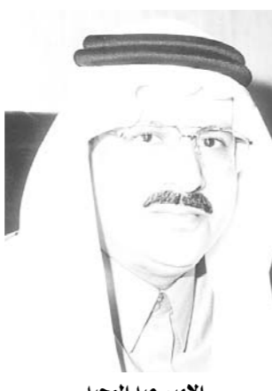
الامير عبد المجيد

يعقد مجلس منطقة مكة المكرمة غداً الاثنين جلسته الثانية ضمن أعمال الدورة الأولى برئاسة صاحب السمو الملكي الامير عبد المجيد بن عبدالعزيز أمير منطقة مكة المكرمة رئيس مجلس المنطقة. وسيتم في الاجتماع الذي يعقد في قاعة الاجتماعات بديوان الإمارة بمكة المكرمة مناقشة عدد من الموضوعات المدرجة على جدول الأعمال الهادفة الى تطوير مستوى الخدمات المقدمة للمواطنين في المنطقة ومحافظاتها إضافة الى استعراض بعض التقارير الواردة من اللجان الفرعية المنبثقة عن المجلس وكذلك بحث احتياجات المنطقة من الخدمات المختلفة.