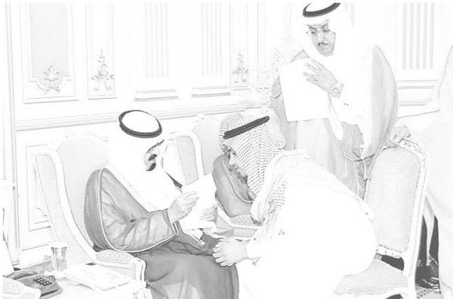
سمو ولي العهد يستقبل الامراء والوزراء والمسؤولين والمواطنين