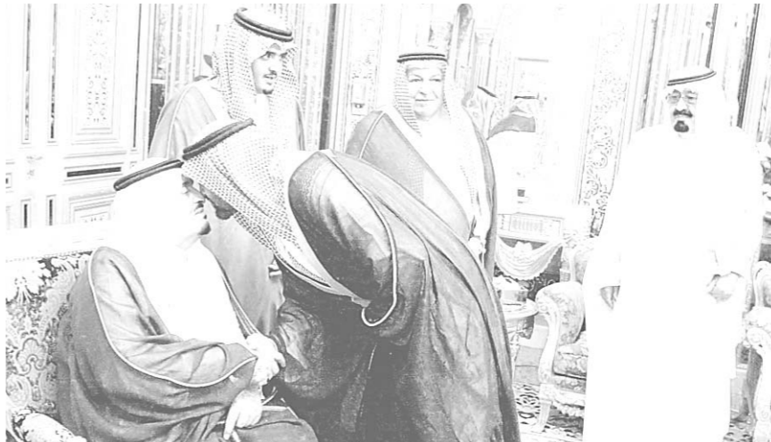
خادم الحرمين الشريفين يستقبل بناء الشيخ زايد آل نهيان