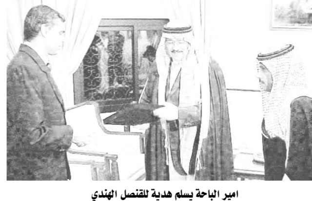
امير الباحة يسلم هدية للقنصل الهندي

صاحب السمو الملكي الامير محمد بن سعود بن عبدالعزيز أمير منطقة الباحة استقبل مساء امس الاول القنصل العام لجمهورية الهند لدى المملكة سيد اكير الدين في منزل سموه وتم خلال اللقاء بحث عدد من الامور المتعلقة بالتعاون بين البلدين واعرب القنصل الهندي عن سعادته بزيارة المنطقة وأشار بما تحظى به من تنمية وتنمية وعمرانيا وسياحية ثم قدم برعاً تذكاريًا لسموه واستلم هدية منه.