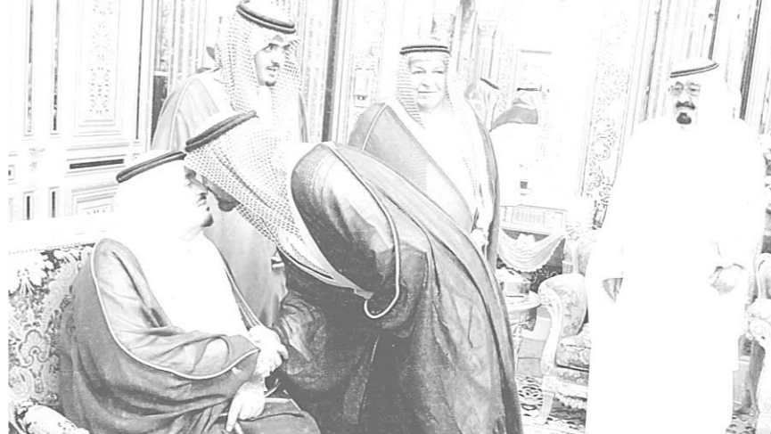
خادم الحرمين الشريفين يستقبل الشيخ زايد آل نهيان

المليك فهد بن عبدالعزيز بن فهد بن عبدالعزيز بركات التعازي والمواساة بوفاة صاحب السمو الملكي الامير ماجد بن عبدالعزيز رحمه الله من: جلالة الملك خوان كارلوس - ملك اسبانيا جلالة السلطان حاجي حسن البلقية- سلطان بروناي فخامة الرئيس عبد العزيز بوتفليقة- رئيس الجمهورية الجزائرية الديمقراطية الشعبية فخامة الرئيس ياسر عرفات- رئيس دولة فلسطين سعادة الشيخ صباح الاحمد الجابر الصباح- النائب الاول لرئيس مجلس الوزراء وزير الخارجية بدولة الكويت الشيخ محمد الخالد الحمد الصباح- نائب رئيس مجلس الوزراء وزير الداخلية بدولة الكويت. وقد اجابهم -ايده الله- بال شكر والتقدير على تعزيتهم ودعواتهم الصادقة وسأل الله سبحانه وتعالى ان يتغمد الفقيد بواسع رحمته ورضوانه ويسكنه فسيح جناته.